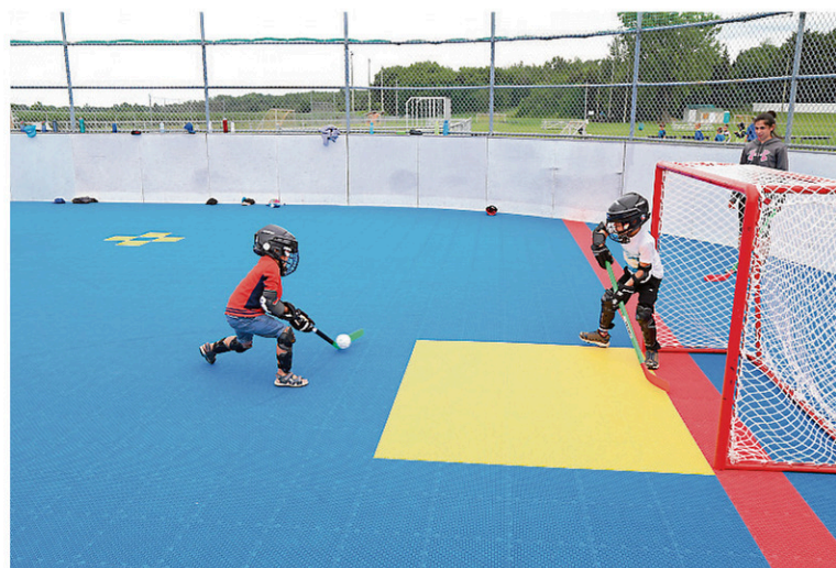
Une surface de dek hockey a été aménagée au printemps au terrain des loisirs. En plus des ligues jeunesse et adultes, les enfants du camp de jour profitent de la nouvelle surface de jeu.

Le terrain des loisirs est plus achalandé que jamais. En plus des dernières nouveautés, l'aménagement d'un skatepark en 2016 a également attiré de nombreux sportifs à roulettes.