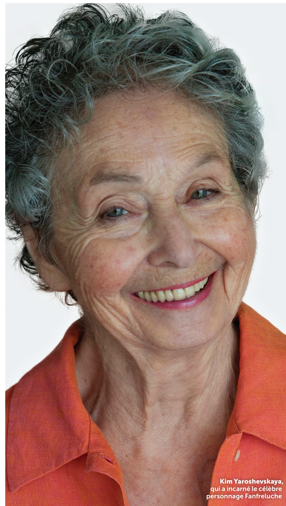
Kim Yaroshevskaya, qui a incarné le célèbre personnage Fanfreluche

Madame Yaroshevskaya a reçu plusieurs prix et nominations pour son impressionnante carrière dont un prix spécial de l'Institut canadien de radiotélévision pour enfants, pour sa « contribution exceptionnelle à la télévision et au bonheur des enfants ». Elle a également reçu le Mérite du français, prix offert par l'Union des artistes et l'Union des écrivaines et écrivains québécois. Depuis 1991, elle est membre de l'Ordre du Canada.