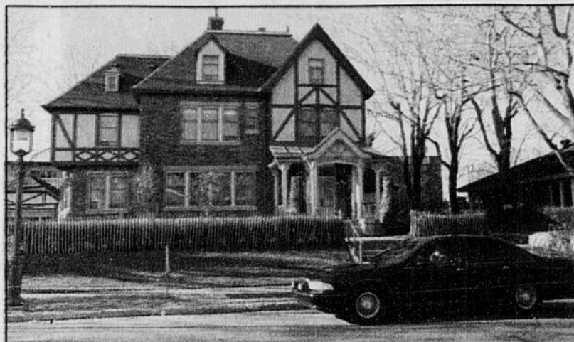
La résidence «de fonction» du premier ministre du Québec est située dans une rue de Québec patrouillée par le gouvernement fédéral.

Le premier ministre Jacques Parizeau et ses successeurs ont maintenant à leur disposition une résidence «de fonction» dans une rue patrouillée par le gouvernement fédéral.