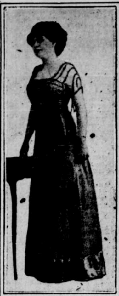
ROBE EN SATIN LIBERTY NOIR

On ne connaît pas assez notre pays, nos Cantons; nous vivons dans une des plus belles parties du pays et un grand nombre l'ignorent. Aux points de vue industriel et agricole, nous pouvons assurer nos lecteurs que leur temps sera bien employé, s'ils s'arrêtent un peu à la visite des différents exhibits de ces classes. Pas une seule personne ne peut visiter une exposition de ce genre sans en retirer un