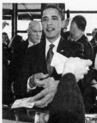
Le président américain a vainement essayé de payer ses achats.

Obama a ensuite pénétré dans une boutique, le sourire