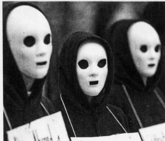
Si le projet de règlement est déposé et adopté lundi, les manifestants ne pourront plus se masquer.

Quant aux conseillers de Vision Montréal, ils décideront