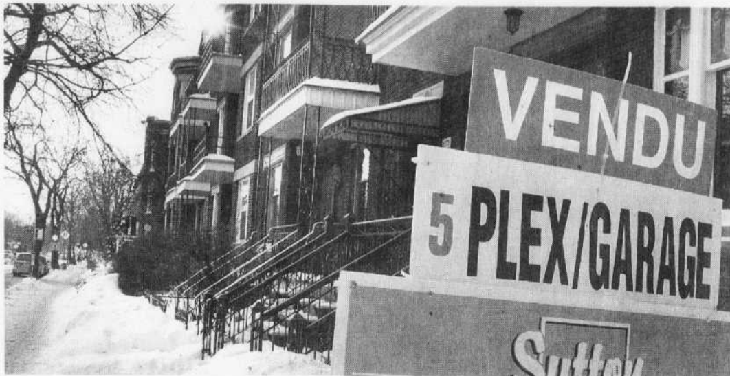
L'acheteur d'une maison devra déboursier en moyenne cette année 207 000 $, comparativement à 210 775 $ en 2008.

De 1994 à 1996, pendant que l'immobilier continuait de subir les contrecoups de la récession, le prix moyen des maisons avait reculé successivement de 0,3 %, 3,4 % et 0,3 %, signalent les données historiques de l'Association canadienne