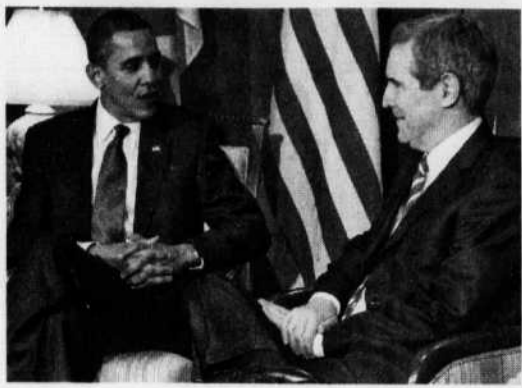
Le président américain, Barack Obama, en discussion avec le chef libéral, Michael Ignatieff.