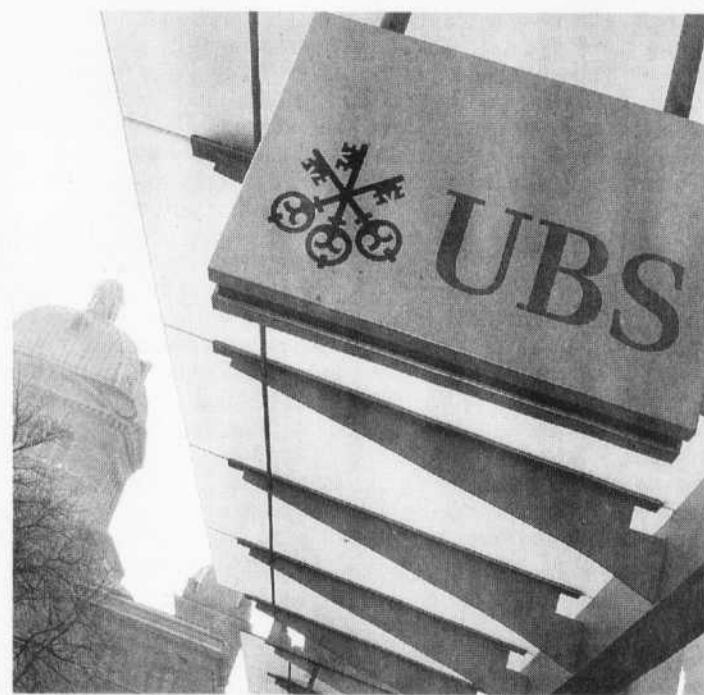
NICHOLAS RATZENBOECK AGENCE FRANCE-PRESSE

Le ministre suisse des Finances Hans-Rudolf Merz avait annoncé un peu plus tôt qu'UBS transmettrait des informations sur 250 à 300 clients américains