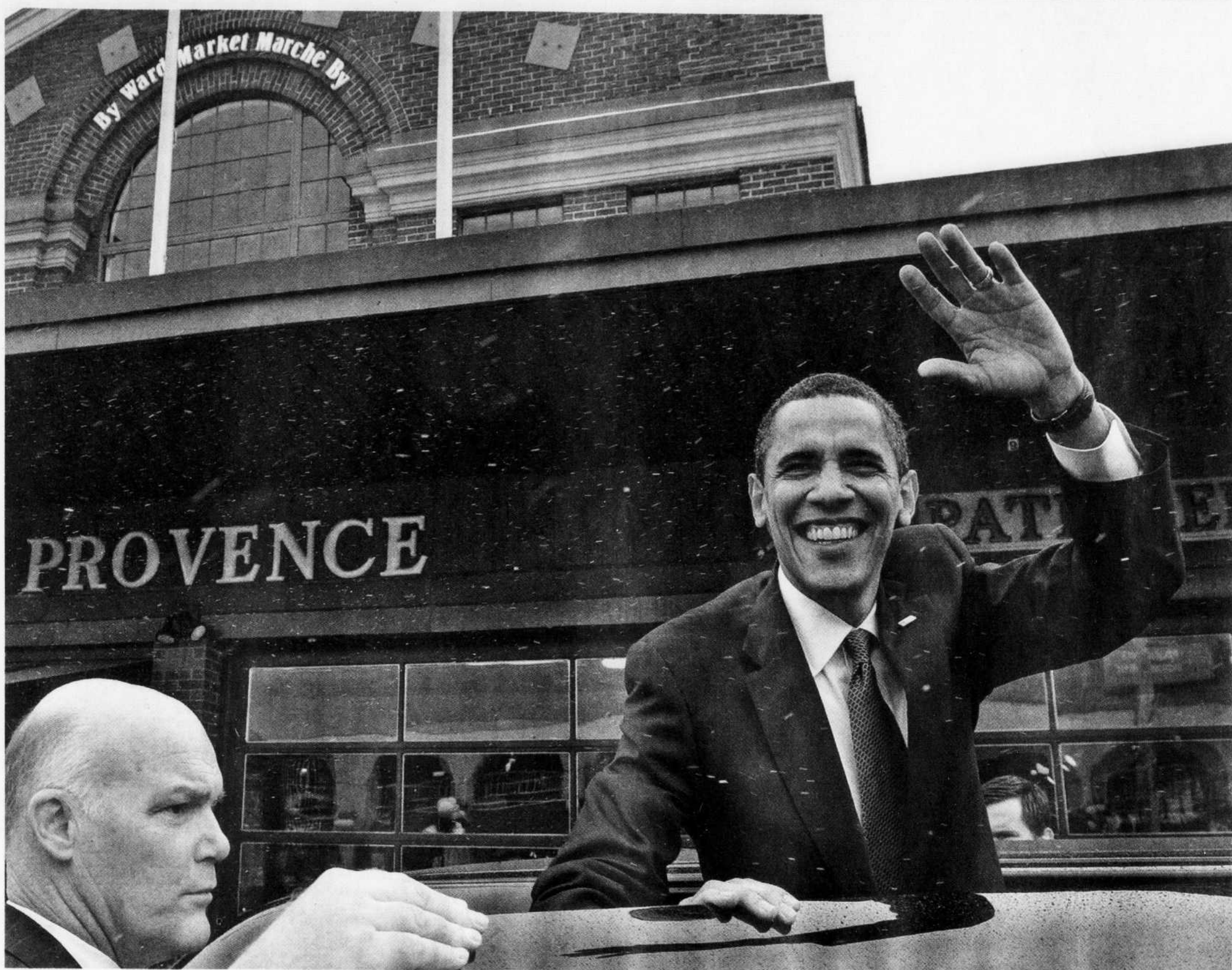
Ce n'est pas sur la colline parlementaire qu'il fallait être hier pour voir Barack Obama, mais plutôt au marché Byward où le président américain a pris un bain de foule et fait quelques achats.