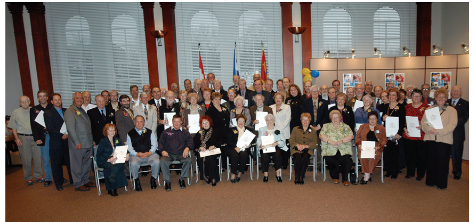
Voici la photo officielle des bénévoles honorés lors de la Semaine nationale de l'action bénévole. Le nom des personnes est inscrit ci-dessous en fonction de leurs années d'implication.

L'arrondissement du Vieux-Longueuil a honoré le 20 avril dernier ses bénévoles de carrière à l'occasion de la Semaine nationale de l'action bénévole . Un hommage particulier a été rendu aux femmes et aux hommes qui œuvrent depuis plus de cinq ans au sein de conseil d'administration d'organismes reconnus. Soixante personnes ont ainsi été honorées, dont neuf nouveaux membres intronisés au prestigieux Club Sélect des bénévoles de carrière .