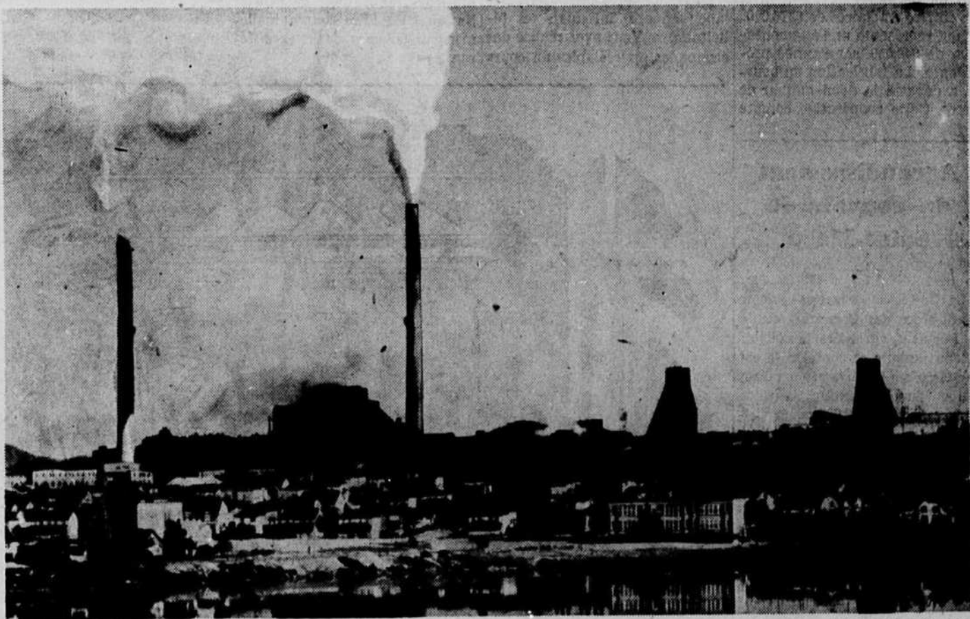
Noranda, une des principales mines de cuivre et d'or du Québec