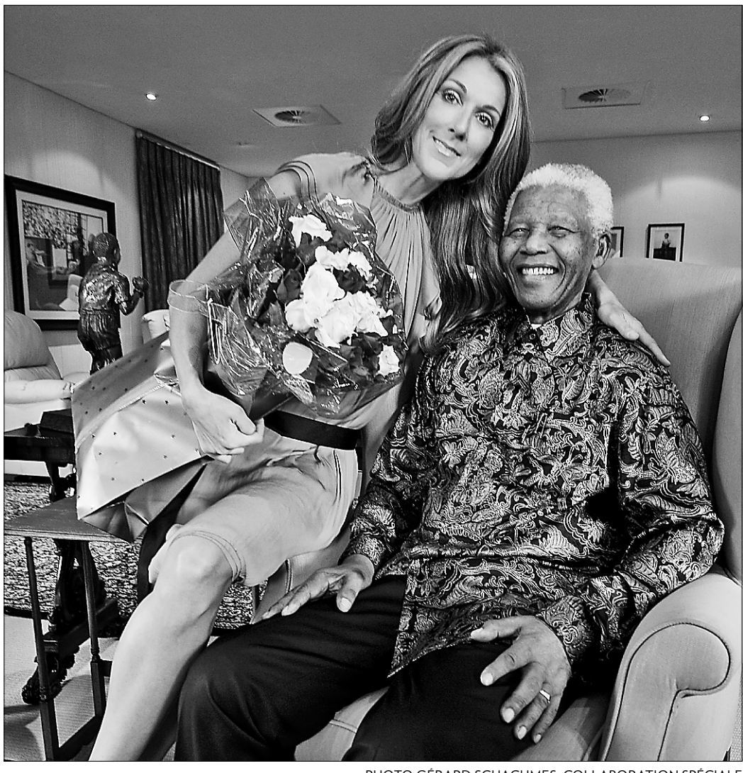
Céline Dion poursuit jusqu'au 1 er mars sa tournée Taking Chances en Afrique du Sud, où elle a rencontré, le 14 février, l'ancien président Nelson Mandela. La rencontre, immortalisée par un photographe, a été le plus grand moment de Céline Dion dans ce pays, ont fait savoir ses proches. Après l'Afrique du Sud, Céline Dion sera à Dubaï, puis à Tokyo. La chanteuse donnera neuf concerts au Centre Bell en août et septembre prochains.