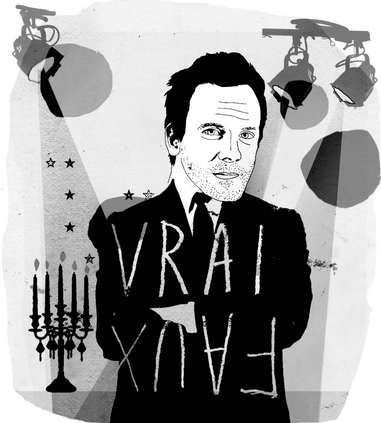
ILLUSTRATION FRANCIS LÉVEILLÉE. LA PRESSE