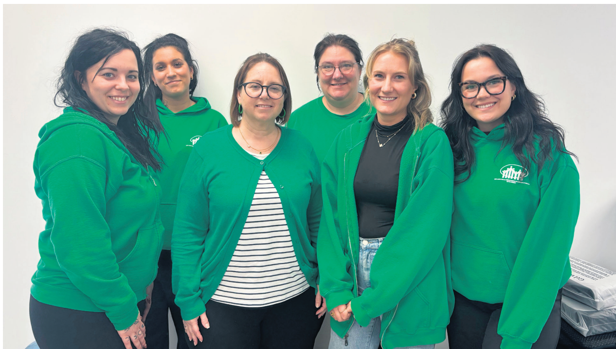
Une partie de l'équipe Les Amis de la déficience intellectuelle.

De plus, Les Amis de la déficience intellectuelle offre une panoplie de services: des activités de jour, des loisirs de soir et de