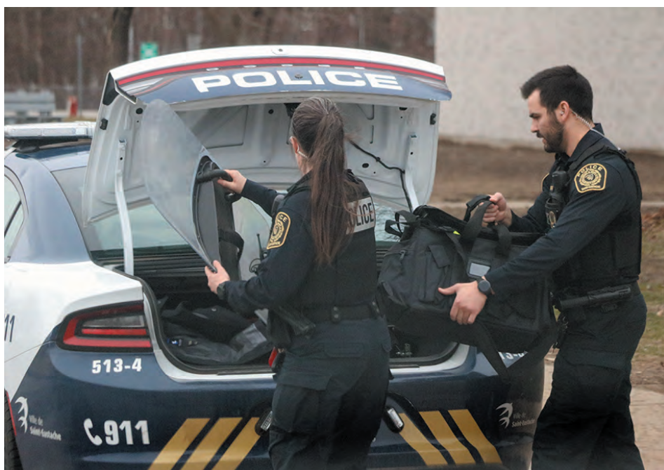
À l'École secondaire des Patriotes, on tente de ramener l'ordre.

ANNE-MERLINE EUGÈNE / ameugene@groupejcl.ca