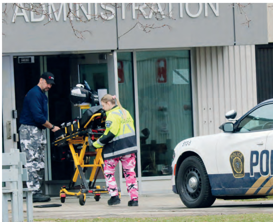
Les intervenants ont rapidement pris en charge la situation lors de l'altercation de mercredi dernier afin d'assurer la sécurité des élèves.

M. Laplante se voulait rassurant, affirmant avoir agi rapidement en collaboration avec les policiers pour assurer un retour au calme et déployer l'équipe de soutien dans les classes.