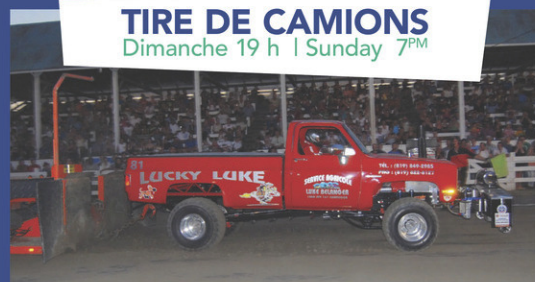
TIRE DE CAMIONS Dimanche 19 h | Sunday 7 PM

No beer bottles or cans allowed on the grounds. Beer may be purchased in the recreation center.