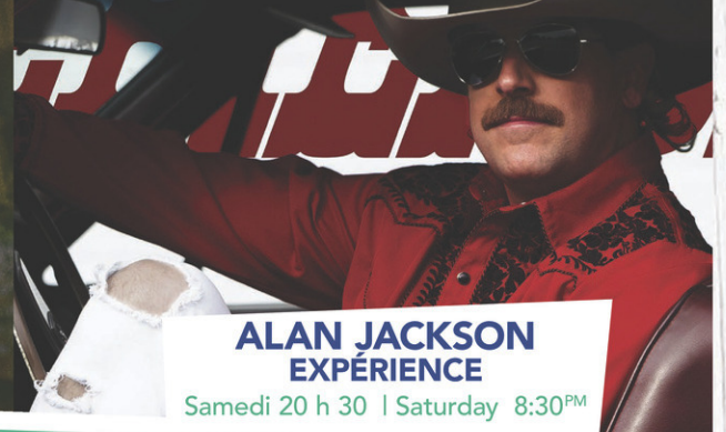
ALAN JACKSON EXPÉRIENCE Samedi 20 h 30 | Saturday 8:30 PM

La barrière ouvre à 12 h jeudi le 24 août