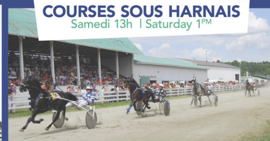
COURSES SOUS HARNAIS Samedi 13h | Saturday 1 PM