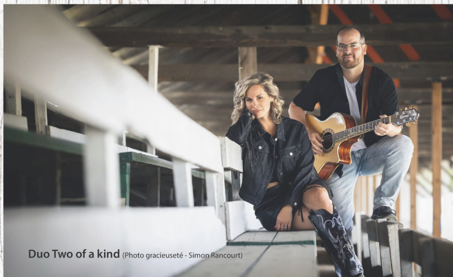
Duo Two of a kind

AYER'S CLIFF. L'EXPO D'AYER'S CLIFF, C'EST BIEN SÛR LES JUGEMENTS D'ANIMAUX, LES DIFFÉRENTES COURSES ET LES INCROYABLES MANÈGES DU SITE. MAIS, C'EST AUSSI DES SPECTACLES ENDIABLÉS QUI FERONT CHANTER ET DANSER LES FESTIVALIERS. VOICI TROIS RENDEZ-VOUS MUSICAUX À INSCRIRE À L'AGENDA!