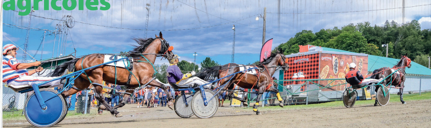
L'Exposition agricole d'Ayer's Cliff est née en 1845. L'événement en sera à sa 176 e édition, car elle a été interrompue par la pandémie.

En 1953, un très intéressant mémoire portant sur la précarité financière des expositions est approuvé par l'Association canadienne en vue de le présenter au Ministère fédéral de l'Agriculture. En plus des difficultés financières, le rapport fait état de la mauvaise presse dont souffrent les expositions partout au Canada. Ainsi, dans son numéro d'automne 1954, le « Farm Quarterly » publie un article intitulé « Are Shows Slipping? » (« Les expositions perdent-elles du terrain? »). L'auteur, Charles R. Koch, y souligne nombre de problèmes importants résultant des normes de jugement et semblant encourager