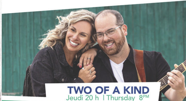
TWO OF A KIND Jeudi 20 h | Thursday 8 PM