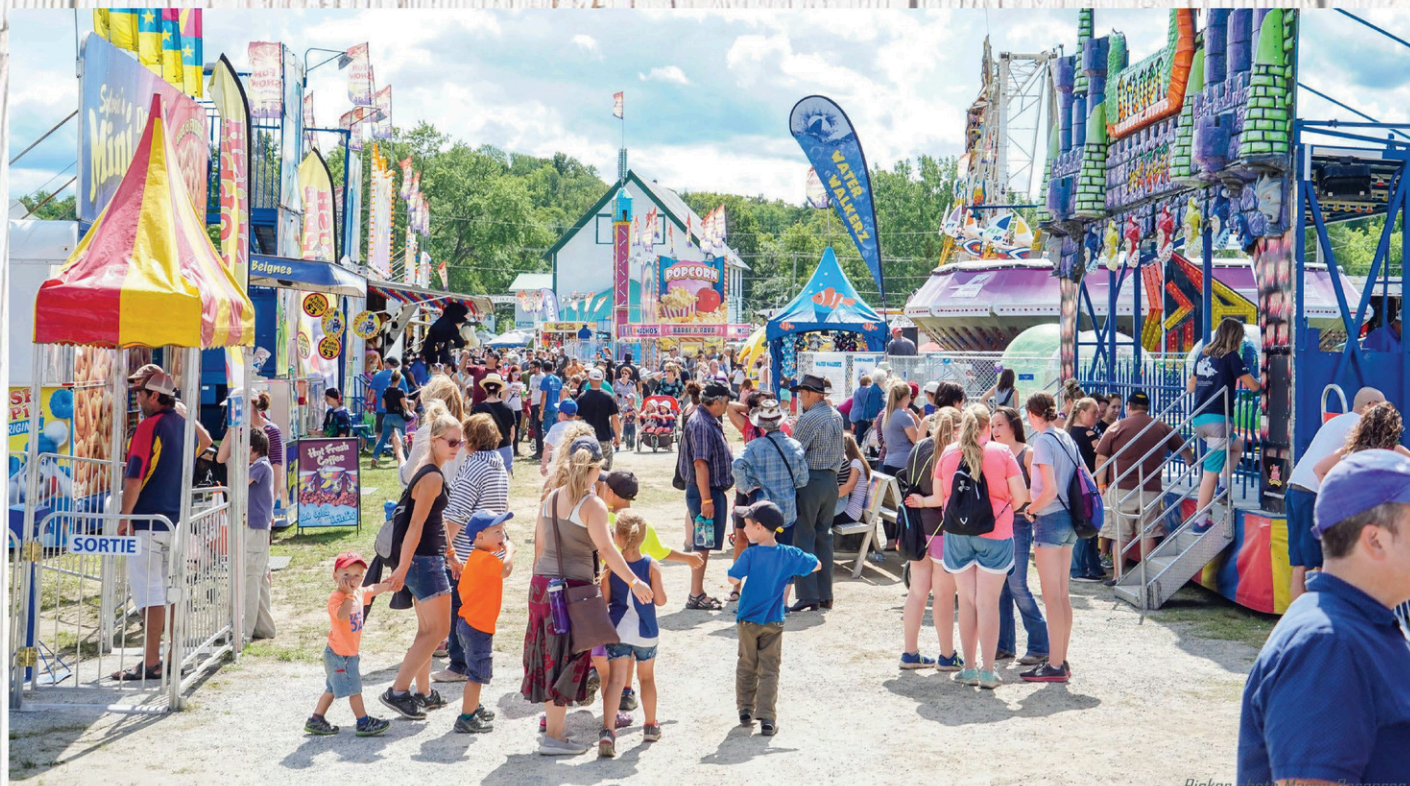
L'Expo d'Ayer's Cliff aura lieu du 24 au 27 août prochain.

Parmi les attractions les plus populaires, notons les courses sous harnais. « Ça attire un très vaste public puisqu'on est le seul rassemblement où il est possible d'en voir. On est