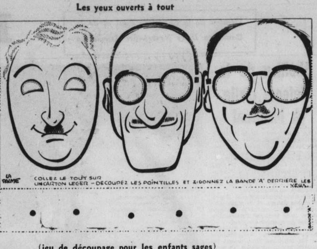
(jeu de découpage pour les enfants sages)

Le système majoritaire, abandonné par la 4e République, avait des inconvénients graves, certains. Ils ont été surabondamment analysés et dénoncés en France. Mais il avait aussi quelques précieux avantages. On le comprend aujourd'hui, devant les déceptions qu'accumule la représentation proportionnelle.