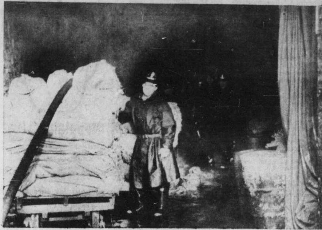
Un incendie, qui a donné beaucoup de mal aux pompiers, a couvé une couple d'heures dans les entrepôts de la compagnie Sendel & Sendel, au 711 rue des Communes, hier après-midi. C'est le deuxième incendie du genre cette semaine, dans le même district. Les pompiers ont dû demander de l'aide pour venir à bout des flammes.