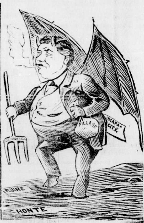
Le même peint par la Patrie.