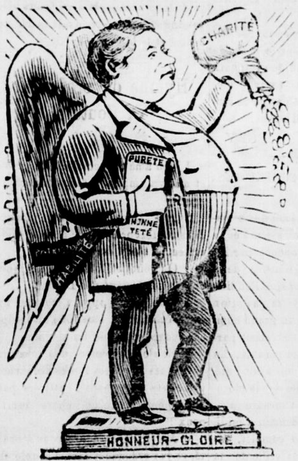
Un ministre tel que représenté par la Minerve.

—Hein, vous autres, écoutez-moi dit-il en faisant résonner les accords... A la bonne heure ! L'animal donne son maître : si la sol, fa... Ah ! gredin de ré ! tu seras le même, va ! Je disais bien que c'était mon instrument.