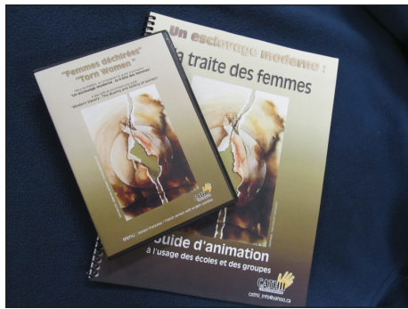
DVD sur la traite des femmes

Des associées, amies et membres de réseaux alliés sont présentes et toutes ressentent l'urgence d'agir. En après-midi, un atelier fit le lien entre la traite et la