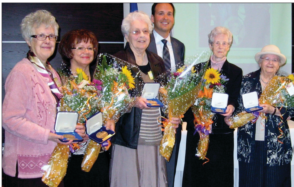
« Nos sœurs en ville »

plication dans le milieu d'Alma. « Nos sœurs en ville... » témoigne d'une solidarité peu commune. Vivre avec les gens du milieu et travailler à la mise en place de nombreuses ressources communautaires, lesquelles sont encore bien vivantes aujourd'hui, grâce à une relève composée de personnes responsables, voilà le bilan élogieux d'une mission bien remplie!