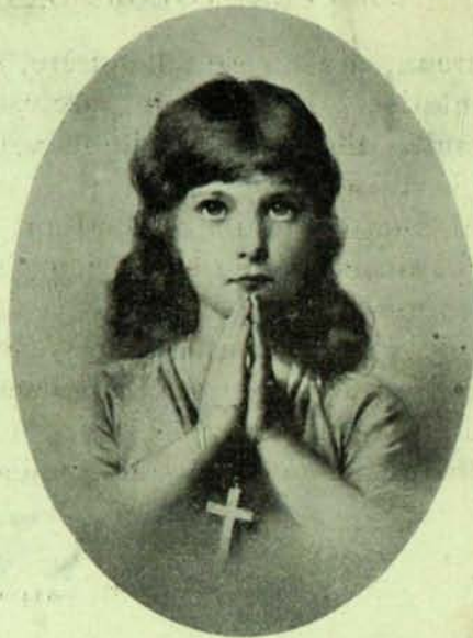
LA FOI d'après F. Dvůrak