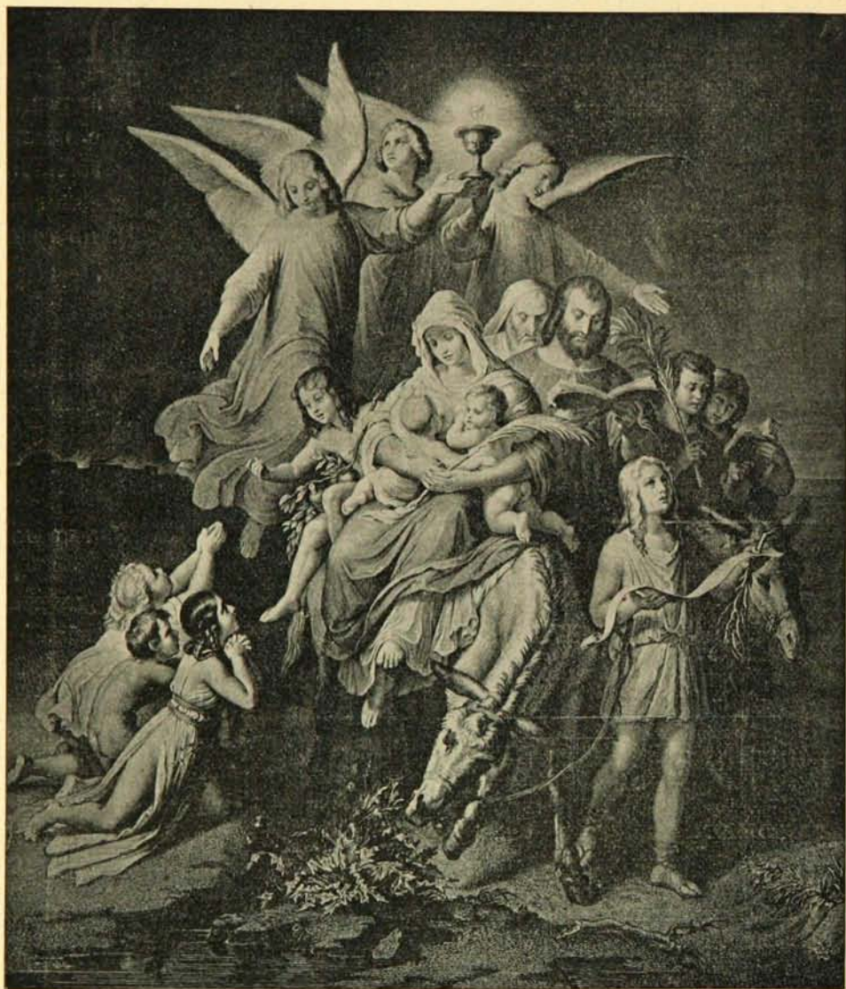
LES CHRÉTIENS S'ÉLOIGNANT DU SANCTUAIRE DÉTRUIT DU JUDAÏSME, fragment du Sac de Jérusalem par Titus d'après W. KAULBACH. Voir REVUE CANADIENNE de 1896, page 138.