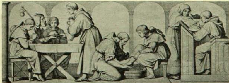
SERVICES RENDUS PAR LES MOINES, Fragment des fresques d'Edouard Bendemann au château royal de Prusse.

EXTRAIT DE LA REVUE CANADIENNE DE MARS 1897