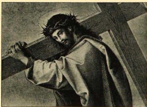
VIA DOLOROSA d'après Raphaël