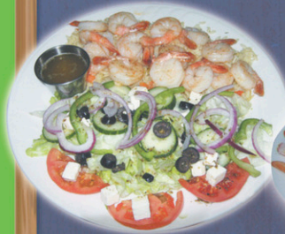
Assiette de crevettes à l'ail avec salade César