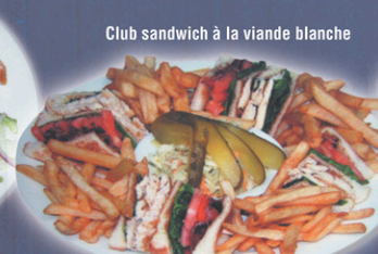
Club sandwich à la viande blanche