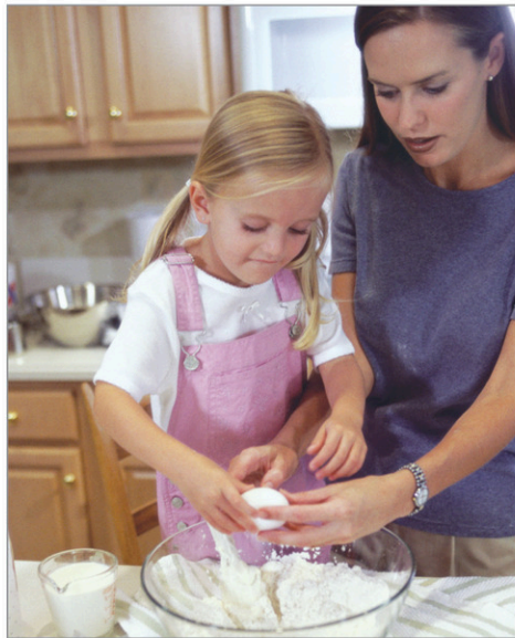
Ma mère m'a appris que la cuisine maison, c'est de l'amour en bol.

Parmi tous ses enseignements, ma mère m'a surtout appris que tout est éphémère, y compris la vie d'une mère merveilleuse.