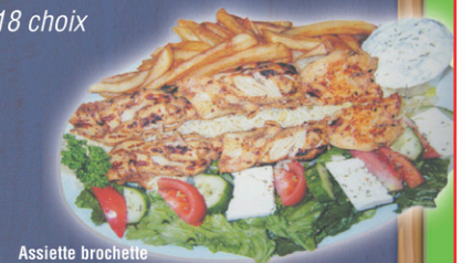
Assiette brochette de poulet avec salade grecque