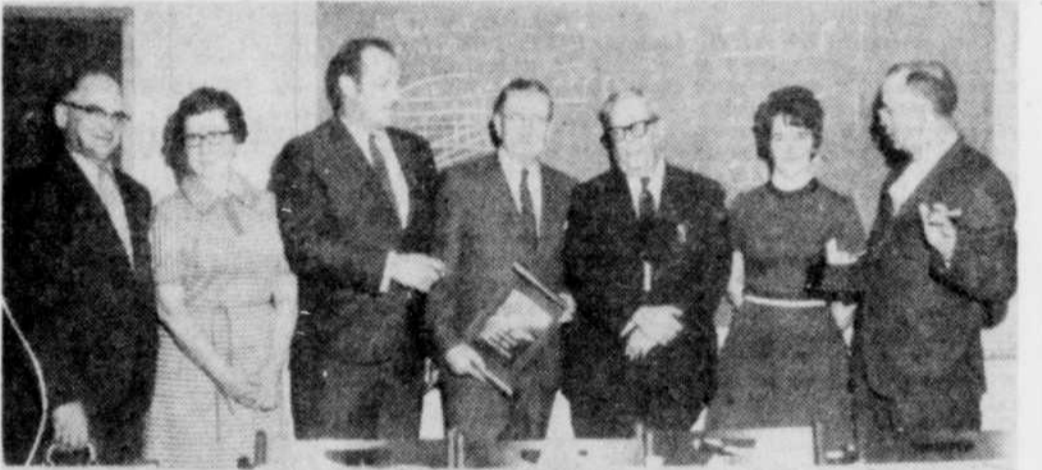
RECONNAISSANCE POUR LONGS SERVICES — Le conseil municipal de Coaticook a tenu à remettre un cadeau souvenir à trois personnes qui ont donné de longues années au service de la communauté coaticookaise.

Le conseil municipal de Coaticook a tenu à remettre un cadeau souvenir à trois personnes qui ont donné de longues années au service de la communauté coaticookaise.