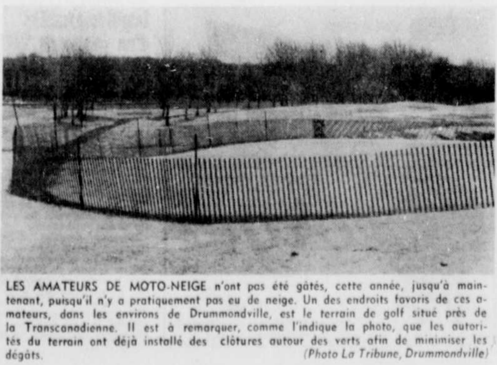
LES AMATEURS DE MOTO-NEIGE n'ont pas été gâtés, cette année, jusqu'à maintenant, puisqu'il n'y a pratiquement pas eu de neige.