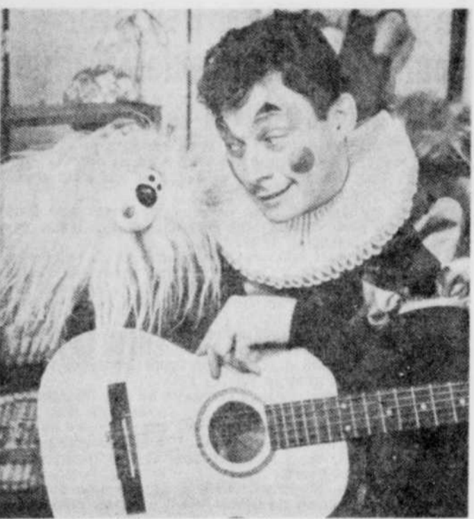
Monsieur Surprise sera au Centre culturel de Drummondville dimanche, le 21 décembre, en compagnie d'autres personnages bien connus de la télévision, dans un grand spectacle pour les tout-petits.