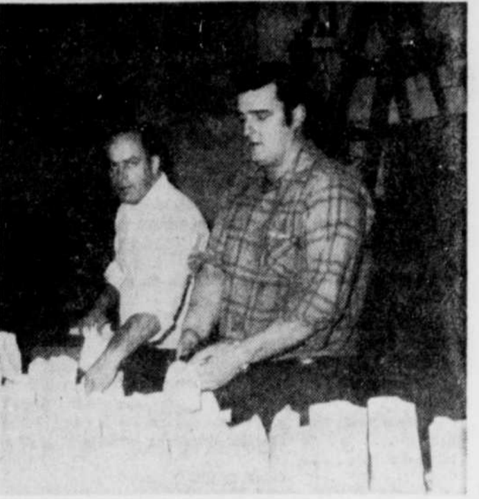
LES CHEVALIERS DE COLOMB du Conseil 2649, d'East Angus, sont à emballer les quelque 2,500 sacs de bonbons en vue de la fête des enfants.