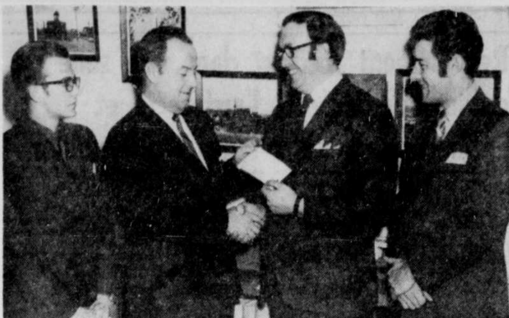
MEMBRE HONORAIRE JEUNE CHAMBRE — Une délégation de la Jeune chambre de Waterloo a rendu visite au premier magistrat de la ville pour lui présenter une carte de membre honoraire de la Jeune chambre locale.