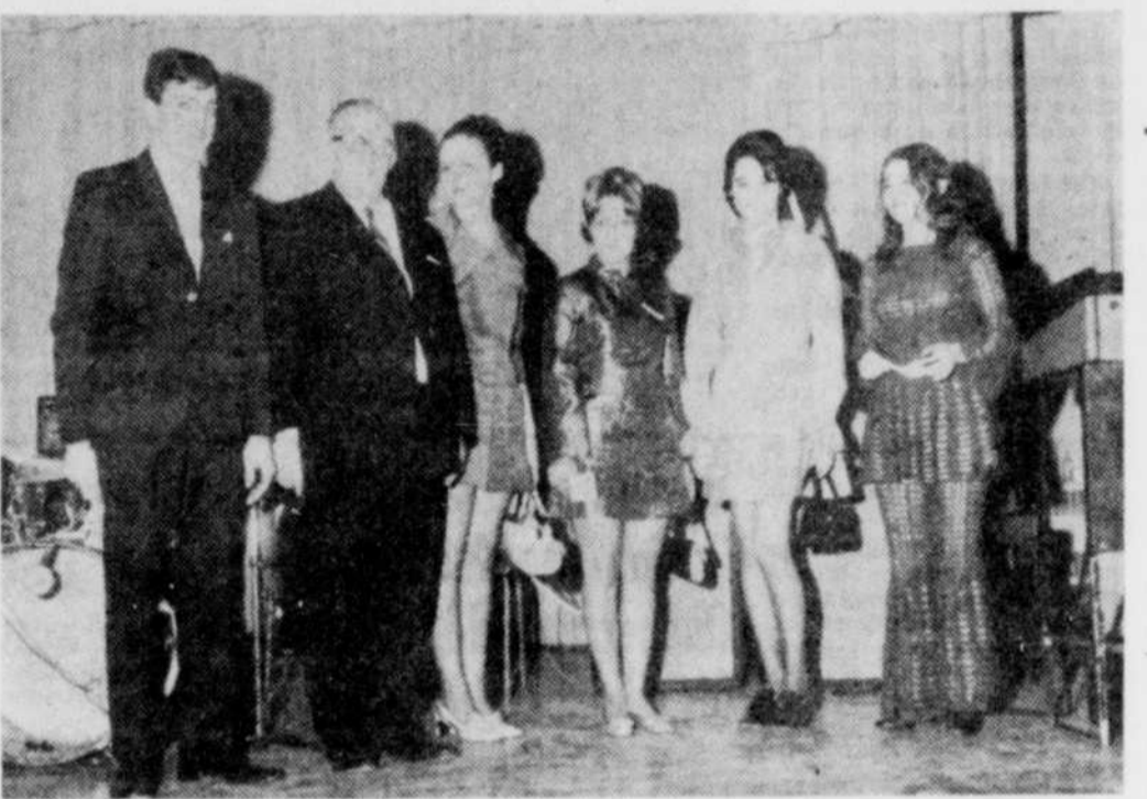
DUCHESSES AU TITRE DE REINE DU CARNAVAL DE COATICOOK — Quatre jeunes filles ont été présentées au public comme candidates au titre de Reine du Carnaval de Coaticook en fin de semaine dernière lors d'une danse à l'école Albert L'Heureux.

Bien que les derniers préparatifs de cette semaine d'activités à Coaticook ne soient pas encore tout à fait complètes, il est très probable que le Carnaval soit tenu au cours de la semaine du 20 janvier au 3 février.