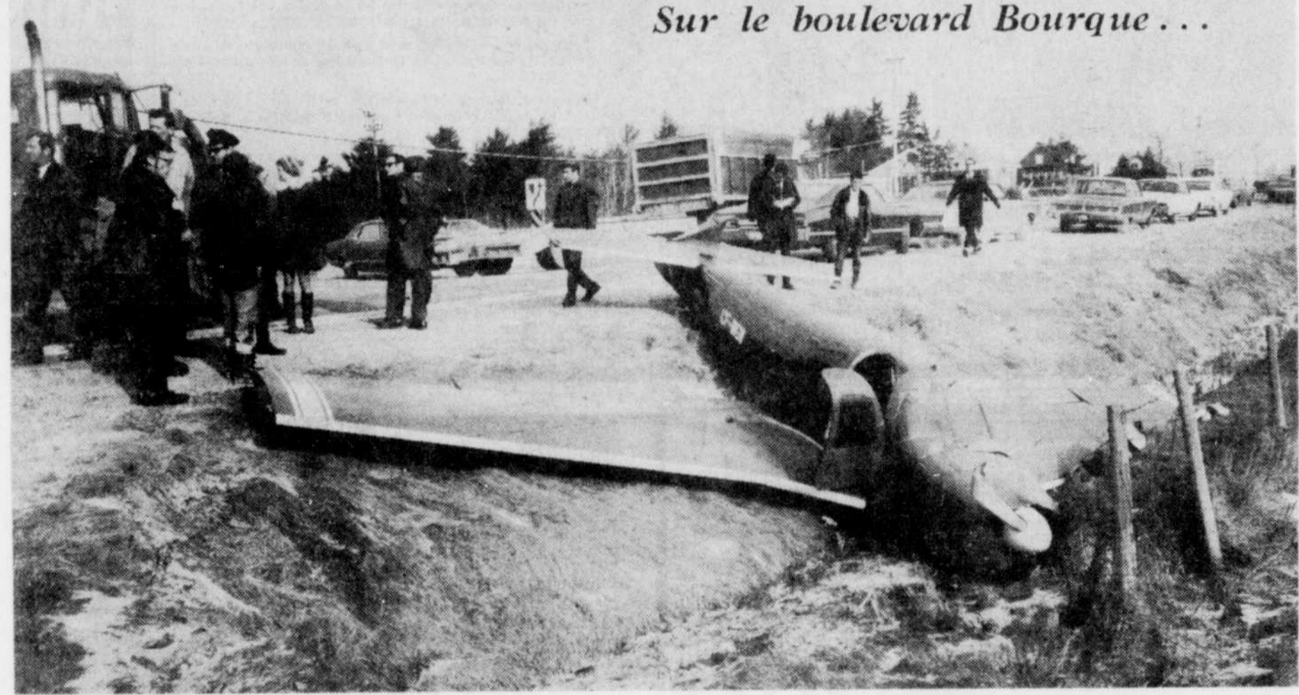
Sur le boulevard Bourque...

"Au ministère de la Famille, nous travaillons actuellement avec les autres ministères. Le ministère de la Justice poursuit sa propre enquête. Il y a également le Commissariat des incendies qui fait la sienne et il y aura probablement le ministère du Travail qui sera impliqué à un titre quelconque parce que c'est lui qui fait la vérification des bâtisses et donne les certificats", a dit M. Cloutier.