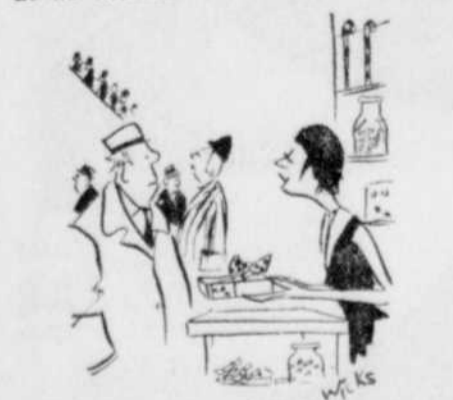
"Les jeunes en raffolent. Ça sent la marijuana".