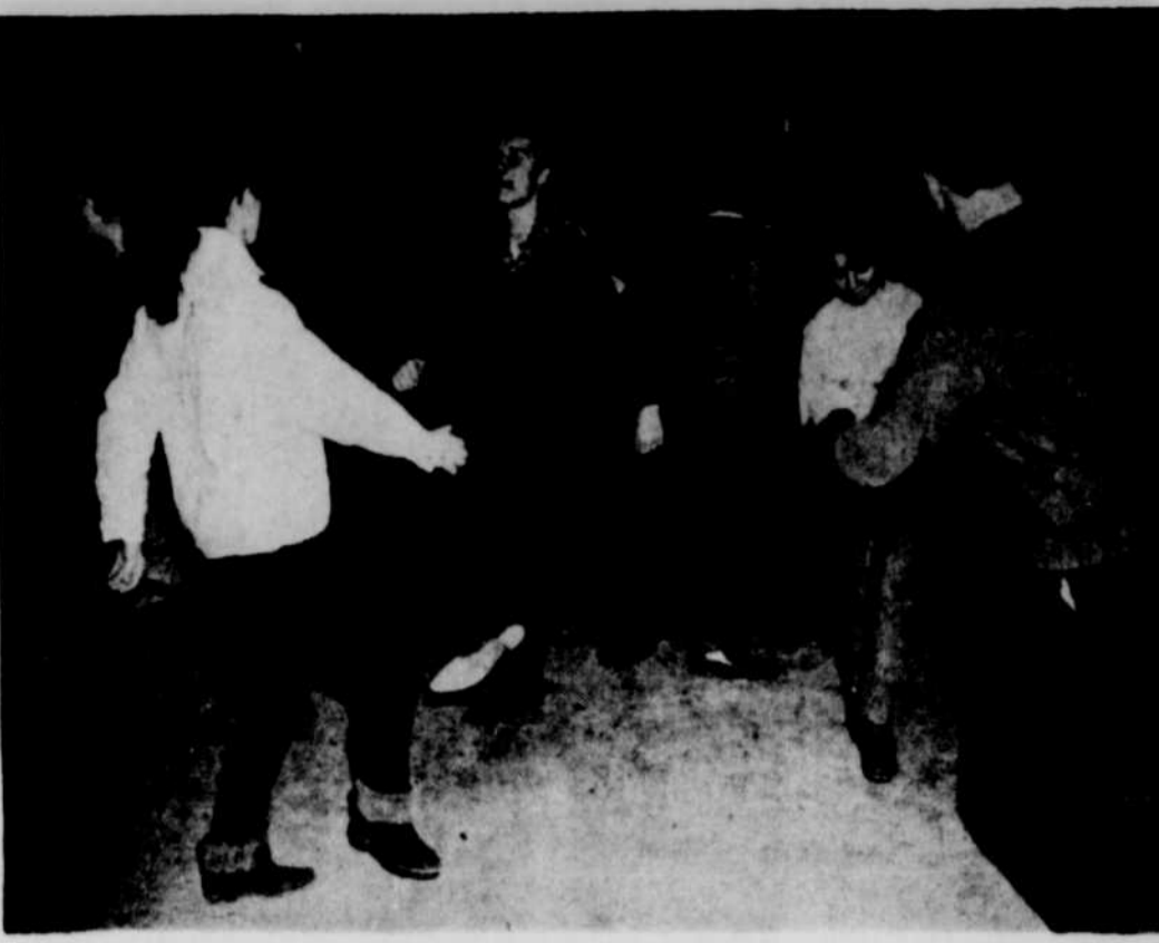
Les danseurs de "twist"

TELEVISION 13 - Entre vous et moi 7.30-2-7-13 - Filles et garçons 5P - Wagon train 6 - Nation's business 8 - News special 10 - Pattes de mouches 12 - Rifleman 7.45-6 - Mr. Fix-It 10 - Yves Christian 8.00-2-7-13 - Côte de sable 6 - Piaydaz 8 - M. Squad 10 - Plus et beau temps 12 - Movie 8.30-2-7-13 - Rues de Québec 8 - Top Cat 5P - Joey Bishop 10 - Troisième homme 9.00-2 - Quatre justiciers 5P-6 - Perry Como 8 - Hawaiian Eye 7 - A première vue 10 - Lutte 13 - Defi au danger 9.30-2-7-13 - Droit de cité 12 - Jack Penny 10.00-2 - Récit 5P - Bob Newhart 6 - News magazine 7-10 - Remous 8 - Naked city 12 - Zane Grey 13 - Télépoliciers 10.30-2 - Vous, familles 5P - Brinkley's journal 6 - Explorations 7 - Télépoliciers 10 - Avec plaisir 12 - Pulse 13 - Alfred Hitchcock 10.45-10 - Nouvelles 11.00-2-3P-6-7-8-12 - Téléjournal - News - Sports - Weather 12 - Movie 11.10-10 - Long métrage 11.15-6 - Viewpoint 13 - Nouvelles sportives 11.20-6 - Local news 8 - Movie 11.25-2 - Commentaires 13 - Météo 11.30-5P - Jack Paar 7 - Long métrage 13 - Le 13 vous informe 11.35-2 - Echos du cinéma 6 - Movie 13 - Hollywood film festival 1.00-13 - CBC TV News