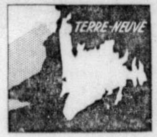
rie du premier ministre terre-neuvien, M. Joseph Smallwood, c'est d'avoir réussi à obtenir tant de subsides du gouvernement fédéral.