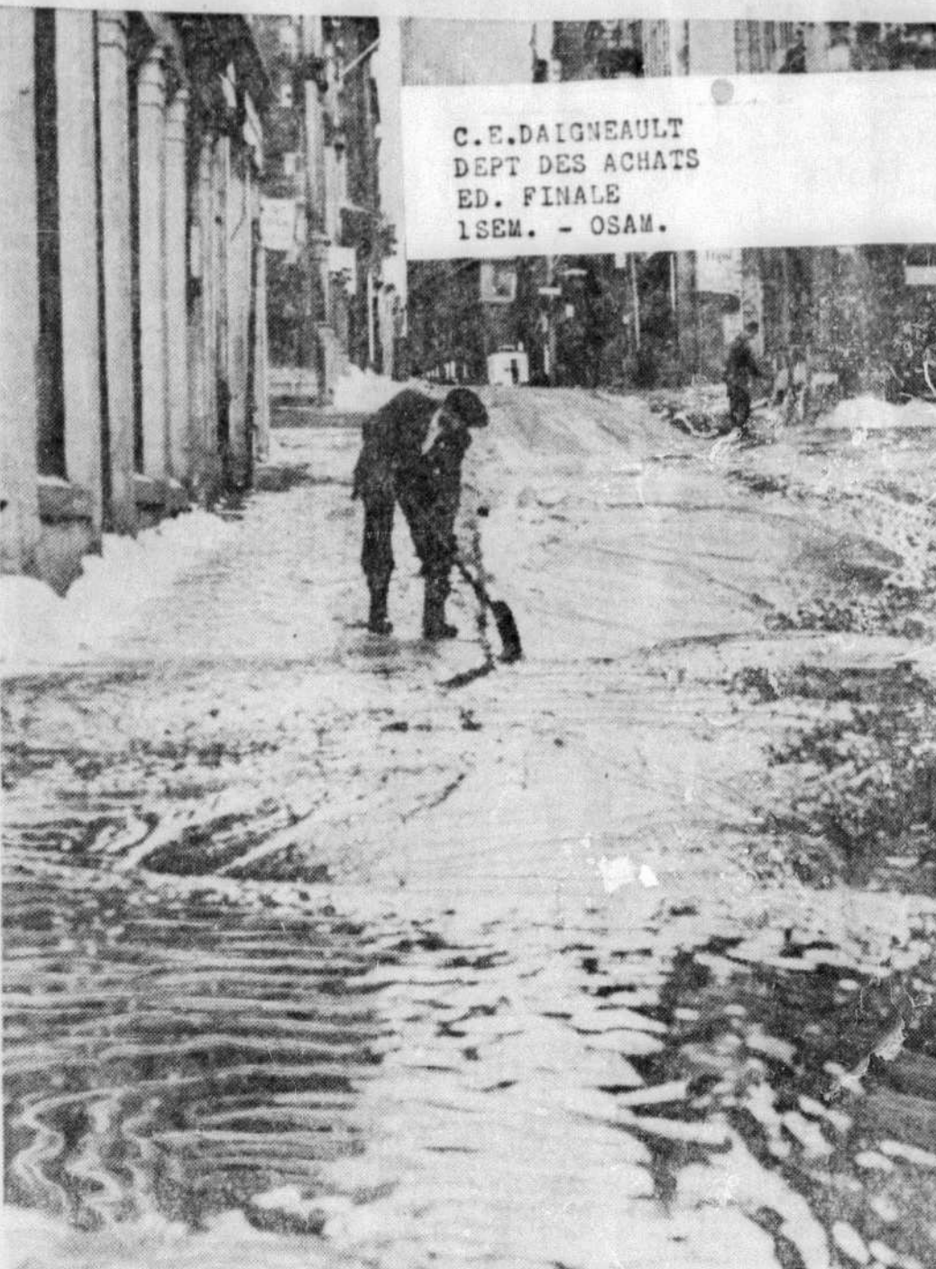
UNE INONDATION NE FAIT PAS LE PRINTEMPS — Le printemps aurait brusquement fait irruption, ce matin, entre la rue Saint-Paul et la place d'Youville, provoquant une subite fonte de la neige que la chaussée de la rue Saint-François-Xavier

l'année en cours n'a pas encore été accepté par le gouvernement provincial qui devra combler un déficit de $1.400.000, et qu'ils ne peuvent raisonnablement engager la responsabilité de celui qui défraiera le coût de l'augmentation des salaires prévue dans le contrat de travail signé le 15 octobre dernier.