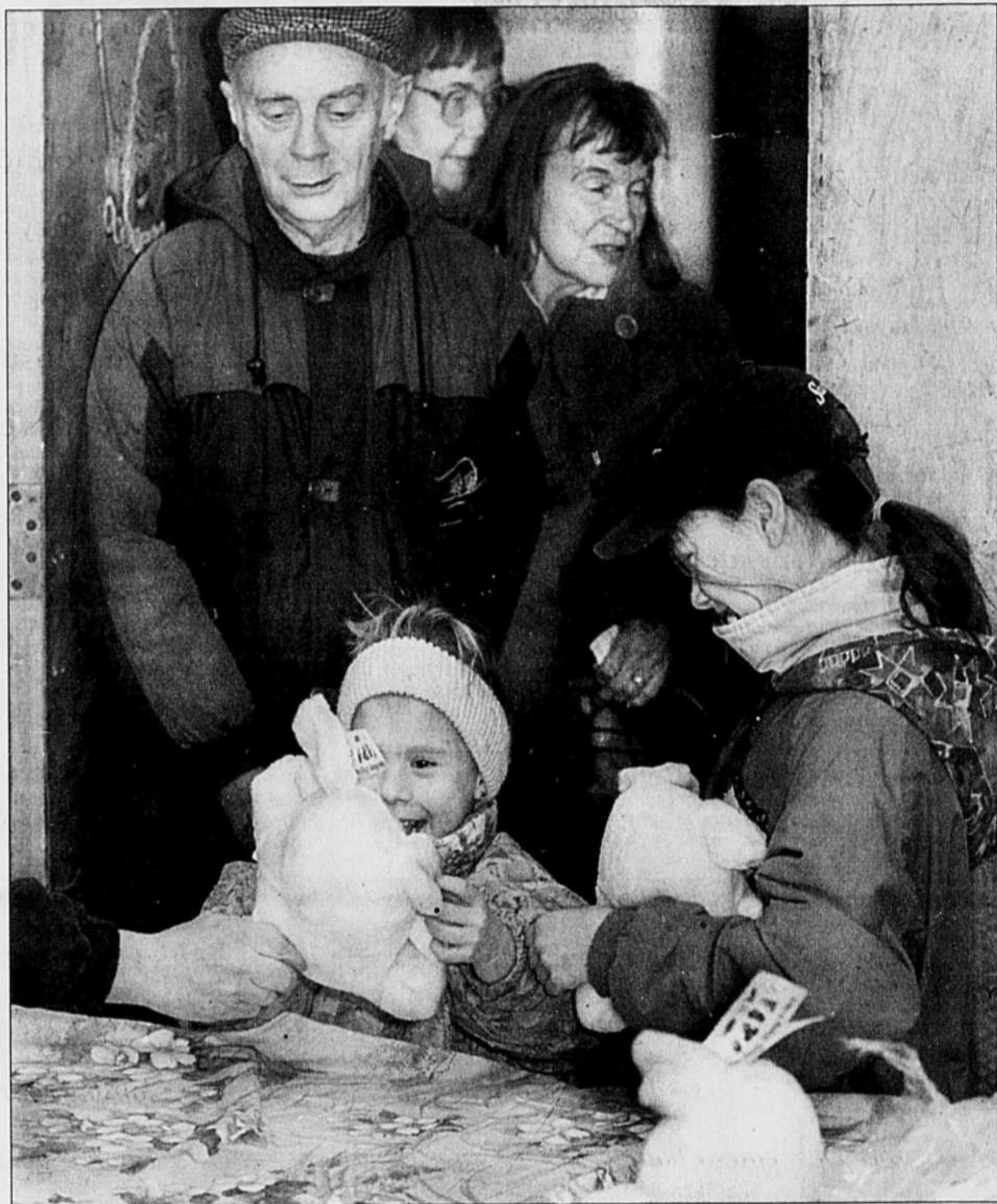
JACQUES NADEAU LE DEVOIR

«Le plus important dans tout ça, c'est qu'en les accueillant ici pour leur offrir un petit plus, on établit un contact avec eux, un lien de confiance», poursuit le directeur des services d'urgence. Et s'ils ont un jour à faire face à de l'abus de la part de la famille, ou à une autre forme de détresse, ils sauront à qui s'adresser.»