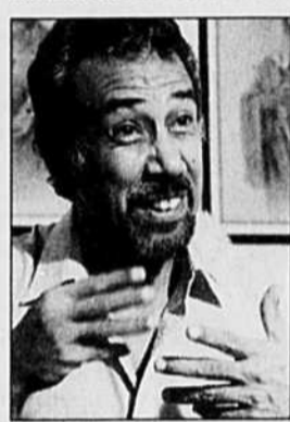
Xanana Gusmao

Jakarta (AFP) — Le dirigeant de la résistance timoraise emprisonné, Xanana Gusmao, a ordonné hier à ses hommes de prendre les armes contre les troupes indonésiennes après avoir appris que les milices pro-indonésiennes avaient tué 17 rebelles est-timorais, a annoncé son avocat.