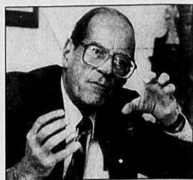
ARCHIVES LE DEVOIR

À l'heure de la mondialisation, au moment où le gouvernement québécois ne cesse de répéter que les affaires se font de plus en plus avec les autres pays qu'avec ses voisins canadiens, il est intéressant de se rappeler qu'avant leur entrée dans la Confédération, les Terre-Neuviens écoulaient effectivement leur poisson aux États-Unis et en Europe bien davantage qu'au Canada.