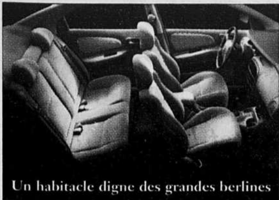
Un habitacle digne des grandes berlines