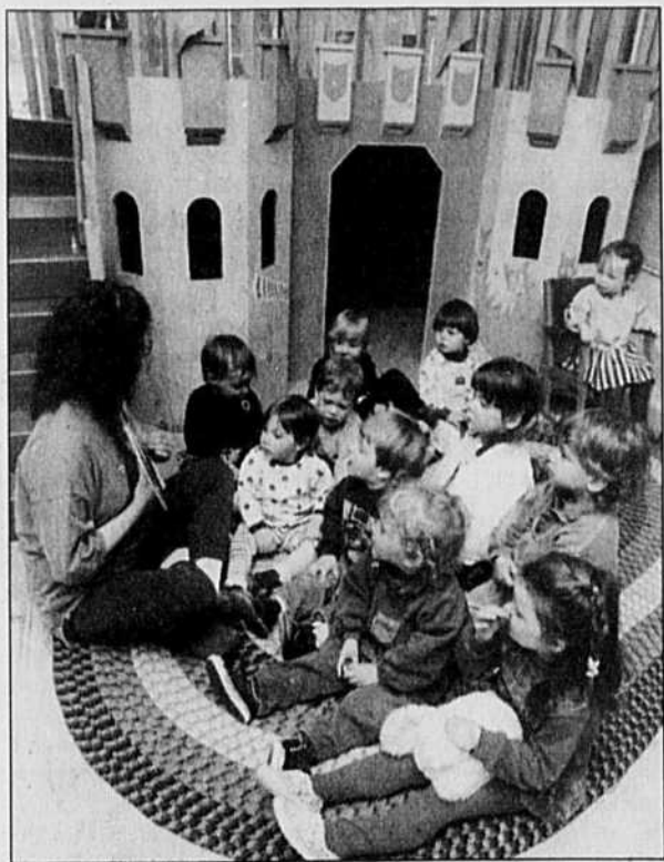
«L'art d'éduquer en préscolaire consiste à donner à l'enfant le goût d'apprendre et éveiller sa curiosité.»

Ces soins de base offrent autant d'occasions d'échanges verbaux entre l'adulte et l'enfant, d'encoura-