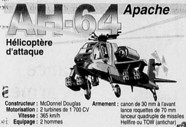
AH-64 Apache Hélicoptère d'attaque

très vite, explique Tham Meechubot, et il nous faudra alors reloger les réfugiés dans des camps. Nous risquons alors de nous rendre compte que l'Albanie, qui manque déjà énormément d'infrastructures, d'écoles par exemple, aura du mal à s'accommoder de cette situation sans une aide internationale massive.»