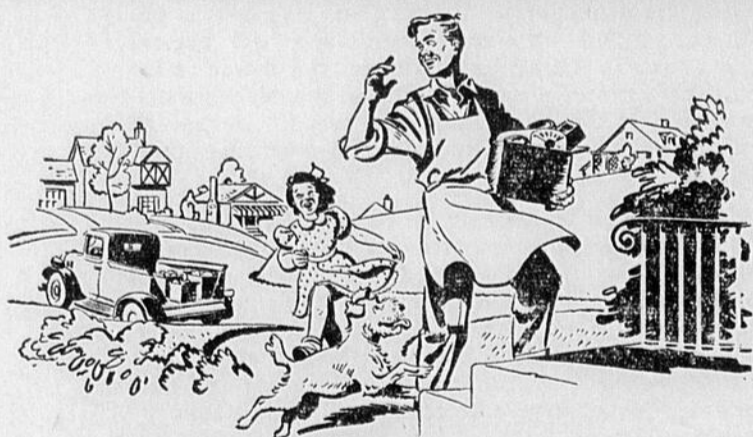
AVANT LA GUERRE: le jeune Jimmy Burke faisait la livraison des épiceries et il rêvait peut-être de posséder un jour son propre magasin.