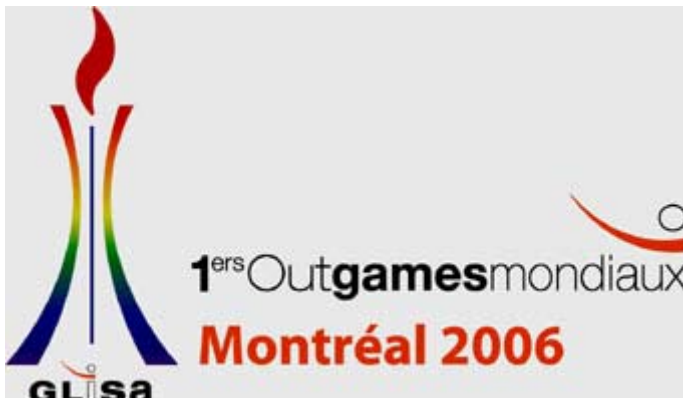
Les 1ers Outgames Montréal 2006

L'organisation des 1ers Outgames mondiaux Montréal 2006 semble déjouer la coutume