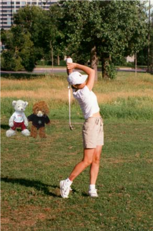
mademoiselle X et ses deux mascottes: Ourson Athlète et monsieur X sous le soleil et au golf...

«C'est être bien riche que de n'avoir rien à perdre...»