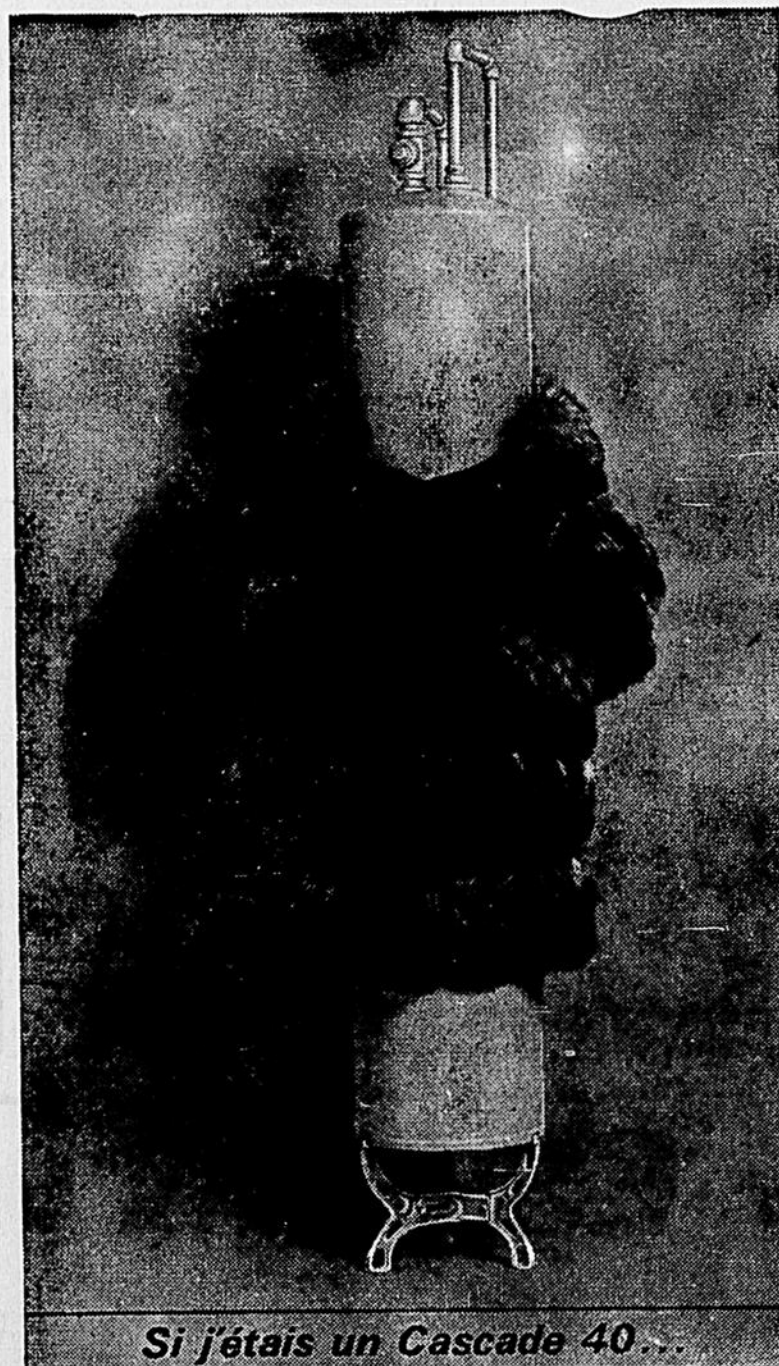
Si j'étais un Cascade 40...