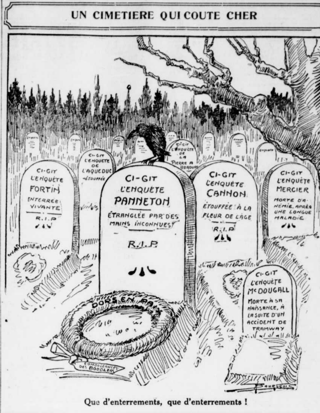
Que d'enterrements, que d'enterrements!

Washington, 25.—Le texte officiel de la réponse de l'Allemagne à la note du président Wilson a été reçu ce matin. Autant qu'on a pu l'apprendre, il n'était accompagné d'aucune autre communication. Le texte de la réponse est à peu près identique à la version non officielle reçue de Berlin, mardi. Il se lit ainsi: "Le gouvernement impérial a accepté et pris en considération avec respect l'amical qui est apparu dans la communication du président. L'initiative prise par le président dans le but de trouver des bases pour y établir une paix durable. Le président dévoile le but que son cœur désire et il laisse le choix des