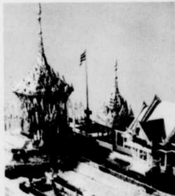
Pavillon de la Thaïlande

avec leur petite amie? Des enfants avec leurs parents? Des congressistes qui veulent bien s'amuser? Des étrangers? Des compatriotes? Parmi toutes les attractions qu'offre la Ronde, laquelle retiendra davantage et d'abord les nouveaux arrivants? L'aquarium et le cirque marin de Montréal? Le fort Edmonton? Le pavillon de la jeunesse? Le gyrottron? Le Jardin des étoiles? Le Village? Le lac des dauphins? C'est ce que nous diront les nouveaux arrivants.