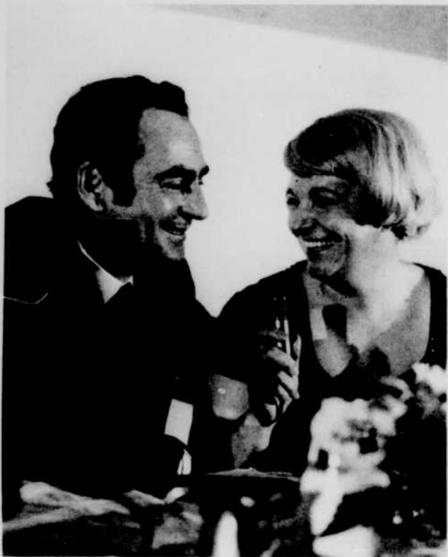
Guy Provost et Lise Payette