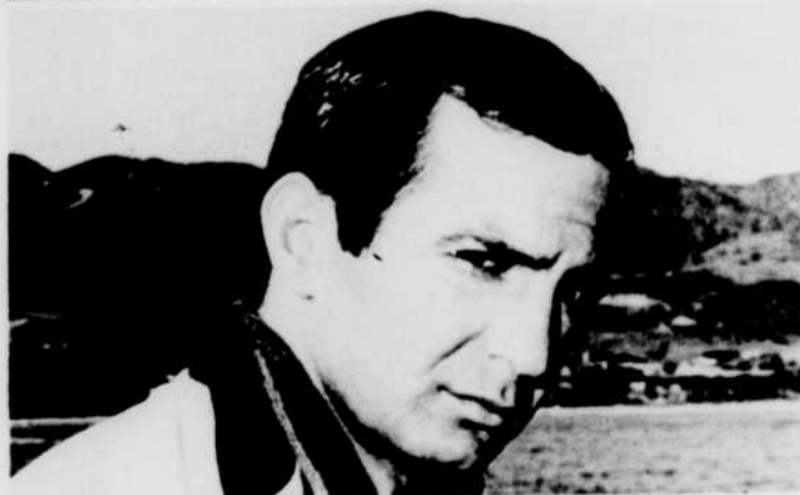
BEN GAZZARA personnifie Paul Bryan dans la populaire série d'aventures "Sauve qui peut", télévisée chaque jeudi à 8 heures du soir.