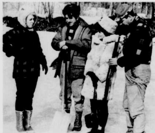
Prêts pour la pêche sur le lac gelé: Micheline Presle, Daniel Gélín, Suzanne Valéry et Claude Blanchard.