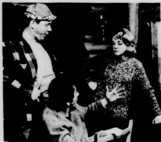
Dans «la cabane au Canada»: Claude Blanchard, Micheline Presle et Daniel Gélín, trois vrais Canadiens.