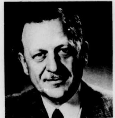
Honorable Roland Michener

La Caravane no 3 sera ouverte au public à l'aréna de Hull, le 1er mai. Après un court séjour dans cette ville, elle se dirigera vers Buckingham, Lachute, Saint-Eustache, Sainte-Anne-de-Beaupré et plusieurs autres agglomérations du Québec. Après un périple de 2 961 milles et des arrêts totalisant 158 jours, la Caravane terminera son parcours le 3 novembre, à Saint-Jérôme.