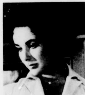
ELIZABETH TAYLOR qui, avec son mari Richard Burton, nous sera présentée à l'émission radiophonique «Mythes et monstres sacrés», samedi à 1 h. 30 de l'après-midi.