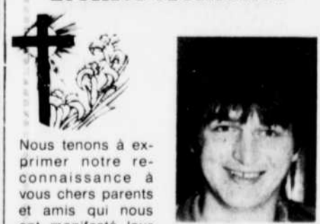
Nous tenons à exprimer notre reconnaissance à vous chers parents et amis qui nous ont manifesté leur sympathie, lors du décès de