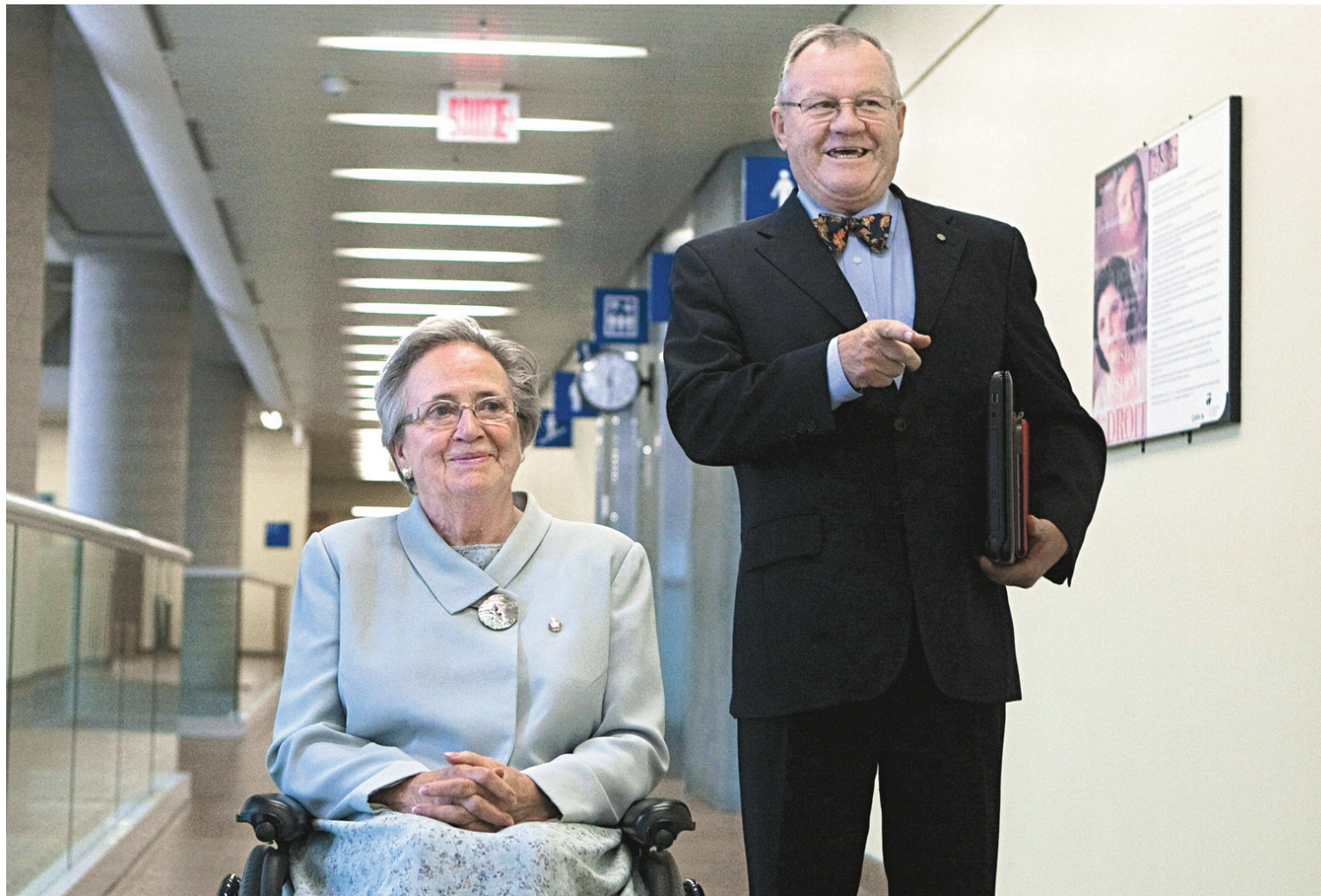
L'ancienne lieutenant-gouverneure Lise Thibault s'est présentée en cour en compagnie de son aide de camp.