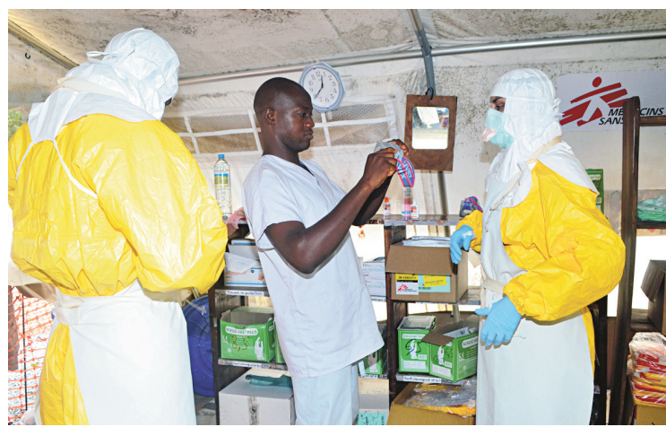
L'ONG Médecins sans frontières est active au Liberia.

Pour tenter de stopper la propagation de l'épidémie, a-t-elle annoncé, «toutes les frontières du Liberia seront fermées à l'exception des principaux points d'entrée» dans cet Etat, ayant aussi pour voisin la Côte d'Ivoire et dont les régions sud sont bordées par l'océan Atlantique. Les points d'entrée qui ne sont pas concernés par la mesure de fermeture sont