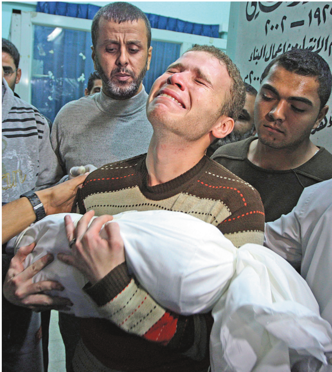
Tous les trois à cinq ans, le monde assiste à une montée de violence et à une guerre sanglante entre Israéliens et Palestiniens.

On se souvient de l'odieux système d'apartheid qui opprima la Communauté non blanche (africaine, indienne et métis) en Afrique du Sud durant trois siècles. Il faut prendre conscience qu'il prit fin sans guerre civile, sans effusion de sang qui aurait tellement pu se produire. Tout cela, à cause du courage d'un homme dénommé Rolihlahla Madiba Nelson Mandela. Le plus célèbre des prisonniers du monde qui échappant à la peine de mort, passa vingt et sept ans de sa vie dans l'une des pires geôles du monde, à Robben Island. Mais, doté de sagesse, d'humanisme et de réalisme politique, Mandela réalisa que la seule issue viable pour son pays était la paix. Car, la violence tient en otage et l'opprimeur et l'opprimé, la vengeance enferme l'un et l'autre dans un cycle de violence sans fin, dans la peur et dans la souffrance.