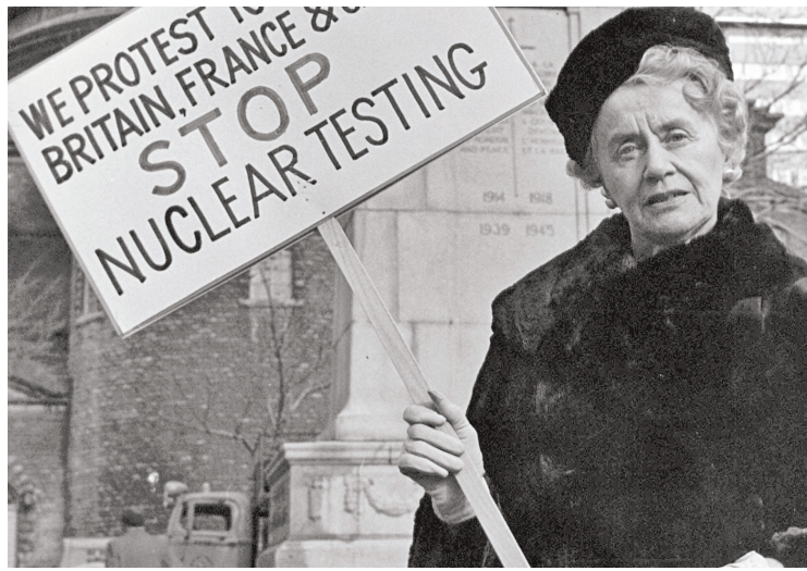
10 novembre 1961. Thérèse Casgrain participe à une vigile silencieuse devant un monument aux morts de guerre, à Montréal.