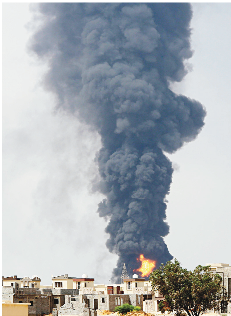
Une gigantesque colonne de fumée a envahi le ciel de Tripoli lundi.

Le porte-parole de la NOC craint une propagation des flammes aux réservoirs de