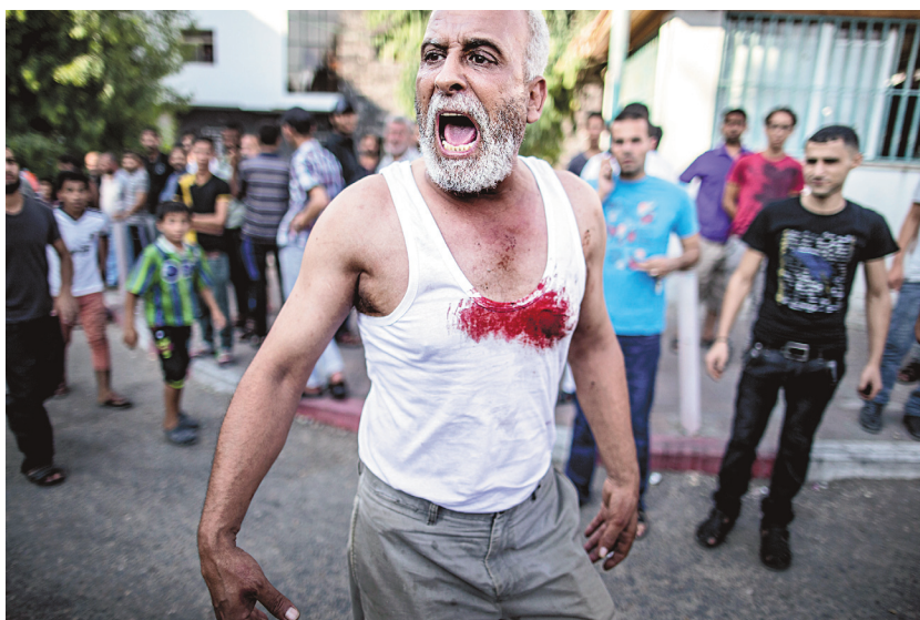
Un Palestinien portant une camisole tachée du sang de son fils manifeste sa rage près de l'hôpital al-Shifa, de Gaza, après une attaque aérienne.

Dix-sept Palestiniens ont été tués dans des frappes à Rafah et dans des tirs d'artillerie israéliens sur le camp de réfugiés de Bureij mardi matin, a indiqué Achraf al-Qoudra, porte-parole des secours à Gaza, à l'Agence France-Presse (AFP). Cela porte à 1104 le nombre de Palestiniens tués à Gaza depuis le début de l'opération israélienne le 8 juillet. À cela s'ajoute la mort de trois civils israéliens et de 48 soldats israéliens. Pour l'armée israélienne, il s'agit là du bilan le plus lourd depuis la guerre contre le Hezbollah libanais en 2006. La journée de lundi s'est d'ailleurs révélée particulièrement sombre pour Tshahal. Quatre de ses soldats, des tan-