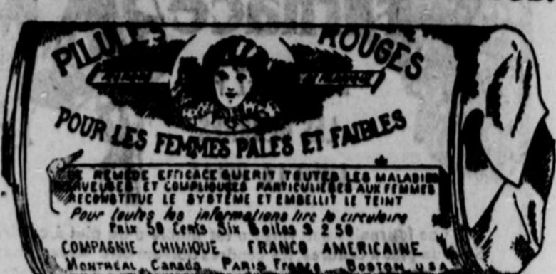
Fac-similé exact d'une boîte de Pilules Rouges.

Nos Pilules Rouges sont une spécialité pour les maladies des femmes seulement; c'est ce qui fait leur force et leur popularité. Il est impossible à un remède de guérir tous les maux. Jamais, dans l'histoire de la médecine, un remède n'a obtenu autant de guérisons que nos Pilules Rouges. Nous demandons à nos nombreuses clientes de ne pas comparer nos Pilules Rouges aux autres remèdes guérissant tous les maux, entre autres, aux remèdes liquides qui ne doivent leur effet stimulant qu'à l'alcool qu'ils renferment.