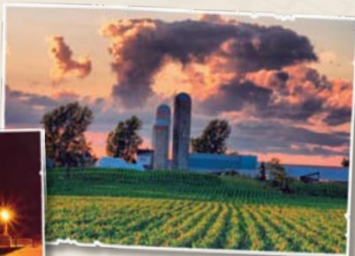
Concours photos 2007 — MRC de Beauharnois-Salaberry Titre de la photo : « Départ d'une nouvelle moisson »