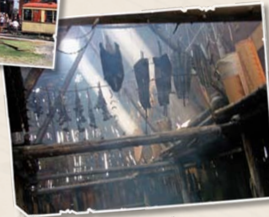
Site archéologique Droulers/Tsiionhiakwatha