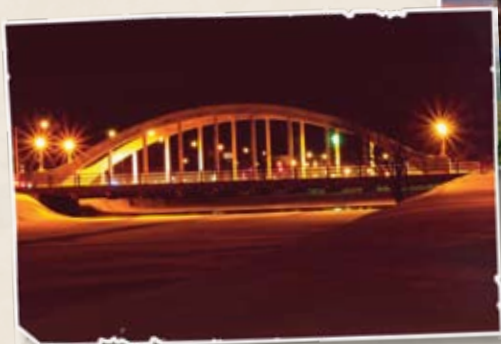
Concours photos 2007 – MRC de Beauharnois-Salaberry Titre de la photo : « Le pont blanc »

De manière générale, les citoyens participent à la vie culturelle de leur milieu de diverses façons, comme en s'impliquant dans la vie associative, en s'adonnant à la pratique d'activités (les loisirs culturels et la pratique amateur) ou encore à titre de consommateurs de produits culturels (fréquentation, achat, comportement). Incidemment, une étude 5 permet de constater que les citoyens qui s'adonnent à la pratique d'une activité culturelle développent habituellement une propension à consommer des produits culturels de qualité, à fréquenter les lieux culturels et à participer à des activités de calibre professionnel. Ils recherchent souvent l'encadrement de professionnels afin de parfaire leur pratique.