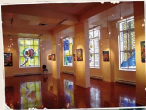
Salle Alfred-Langevin, Huntingdon

On constate une approche intégrée en tourisme culturel, où les éléments d'intérêt culturel sont non seulement accessibles dans différents lieux de diffusion, mais aussi jumelés à de nombreux événements populaires ainsi qu'à des circuits récréotouristiques.