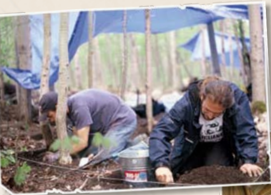
Fouilles archéologiques, Saint-Anicet

L'implication citoyenne en culture reste aussi un secteur à développer que ce soit par les loisirs culturels, une offre de formation en arts, ou encore, des activités d'encadrement et de formation du bénévolat.