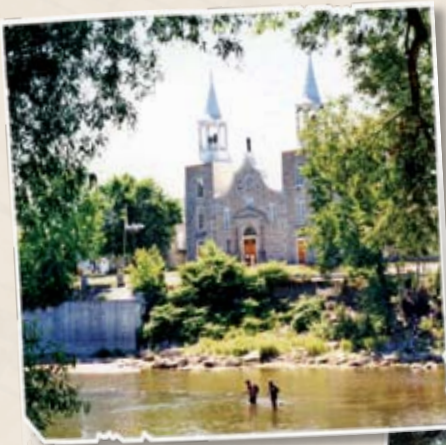
Église Saint-Joachim, Châteauguay

Sur le plan économique, la Vallée-du-Haut-Saint-Laurent tire profit de sa proximité avec Montréal tout autant que de son positionnement au carrefour des autres grands marchés que constituent l'Ontario et les États-Unis. Cette localisation avantageuse au centre d'un bassin potentiel de visiteurs a contribué à l'émergence d'une offre récréotouristique importante, où le patrimoine archéologique s'impose comme un axe majeur de développement, puisque, à ce chapitre, la Vallée-du-Haut-Saint-Laurent est un territoire d'exception à l'échelle du Québec.