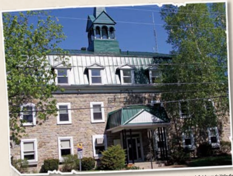
CRÉ Vallée-du-Haut-Saint-Laurent, Salaberry-de-Valleyfield