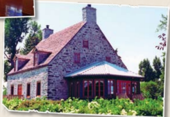
Maison Melançon, Roussillon