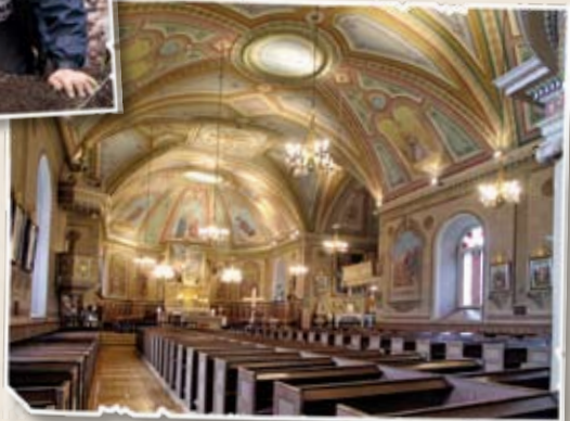
Église Saint-Michel, Vaudreuil-Dorion (Fondation du patrimoine religieux du Québec, 2003)