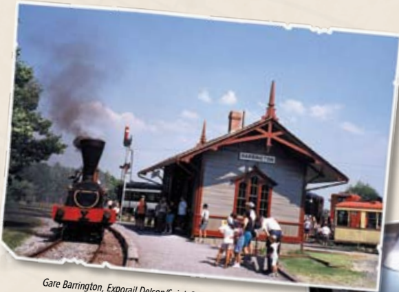
Gare Barrington, Exporail Delson/Saint-Constant