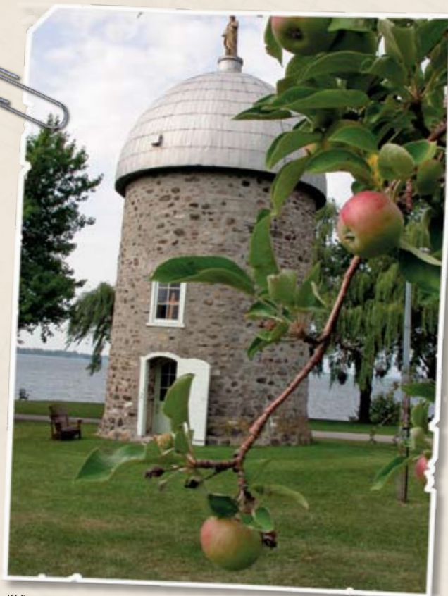
Héritage Saint-Bernard, Châteauguay