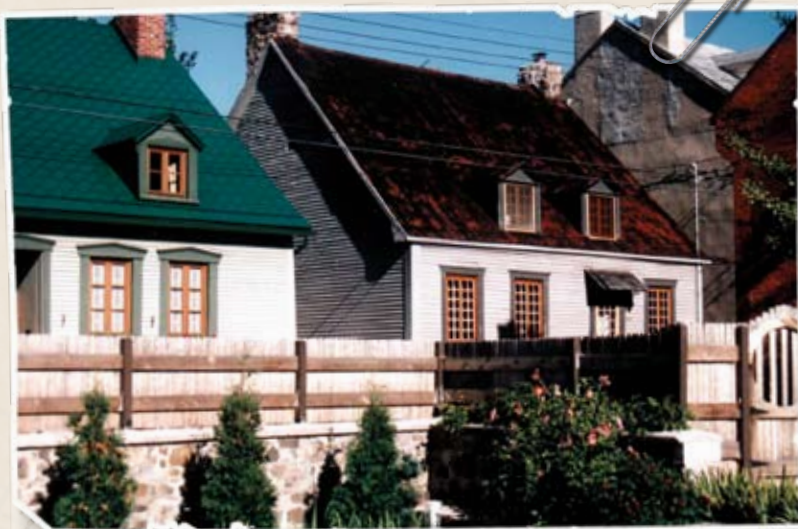
Vieux La Prairie, Roussillon