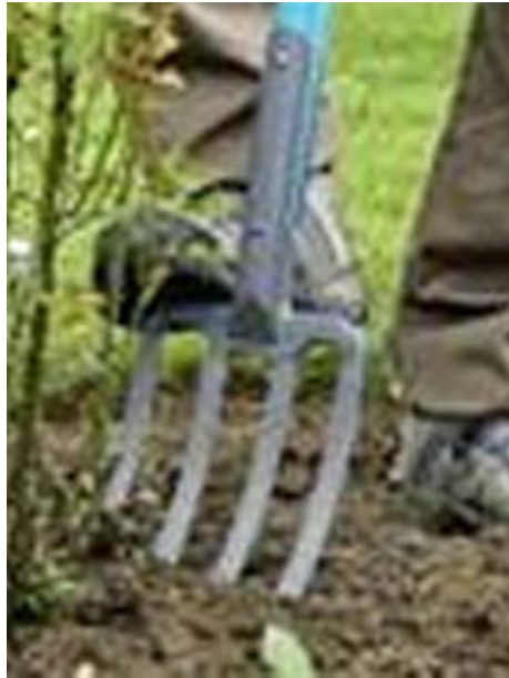
Fourche à bêcher

terreau est plus écologique à long terme.