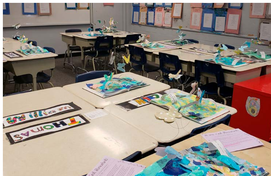
Les élèves ont réalisé des bricolages en incorporant les lettres des anciens de l'école.