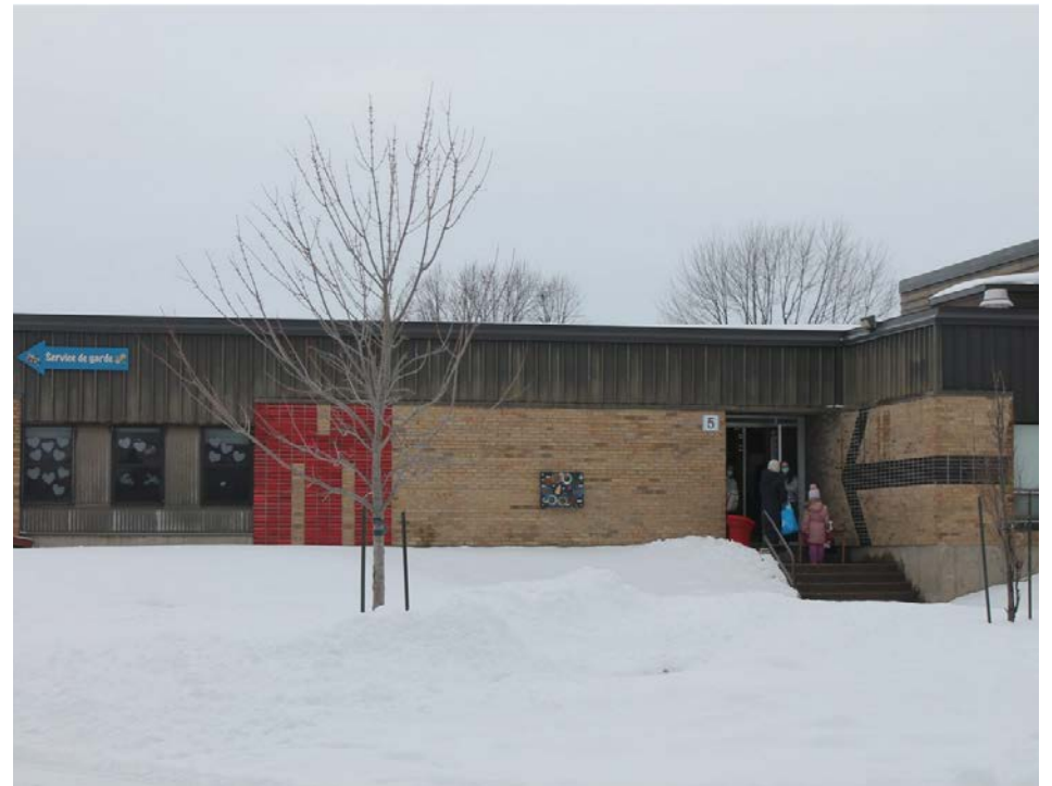
Des anciens élèves en ont profité pour rendre visite à leurs anciens enseignants.

Le projet des élèves de sixième année a particulièrement attiré l'attention. À partir d'un livre ouvert, ils ont intégré des phrases contenues dans diverses lettres. Par la suite, des papillons ont été installés sur de petits fils de fer, créant un effet en trois dimensions au projet. « Les phrases provenant des lettres