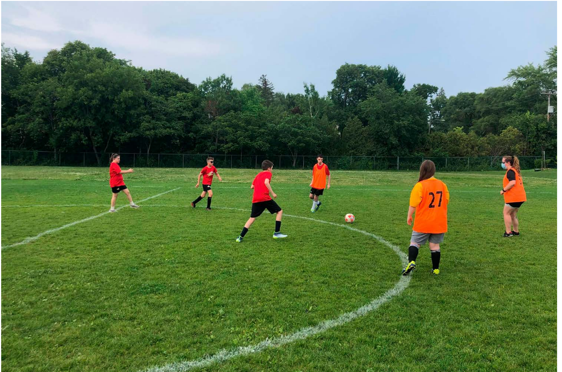
La prochaine saison de soccer adapté des Amis-Soleils s'amorcera au mois de mai.

La prochaine saison de soccer adapté de l'organisme Les Amis-Soleils de Saint-Bruno se déroulera du 25 mai au 17 août.