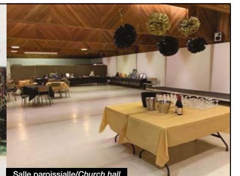
Salle paroissiale/Church hall

Église catholique St. AUGUSTINE of CANTERBURY à Saint-Bruno Unité pastorale anglophone de Saint Jean Paul II