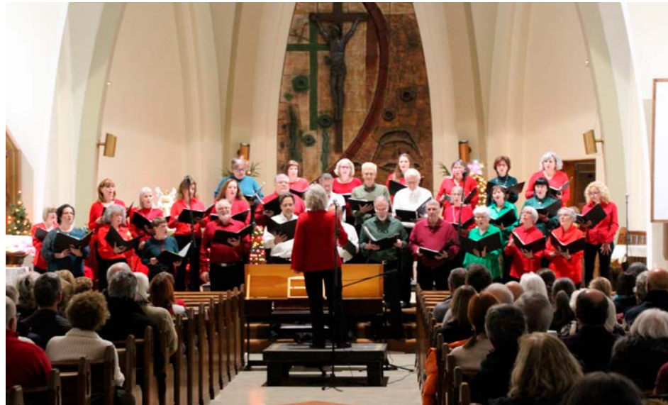
Le Chœur Vox Terra présentera un concert printanier.

Pour rendre ce concert possible, la chorale travaille sans relâche depuis le mois de janvier 2023. Une quinzaine de répétitions en groupe ont été nécessaires. « La préparation se passe bien, ça va toujours très vite. Ça exige un bel engagement, beaucoup de présences pour les pratiques en groupe,