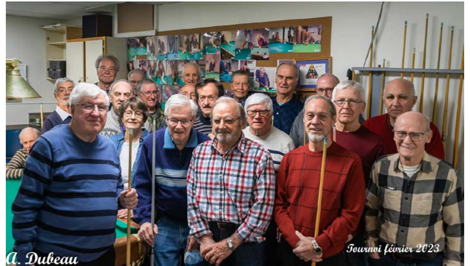
Le groupe de participants au tournoi amical de billard.

Récemment, un tournoi amical a été organisé au sein des adeptes. Une vingtaine de joueurs et joueuses se sont affrontés. Les gagnants ont obtenu une bourse et se sont