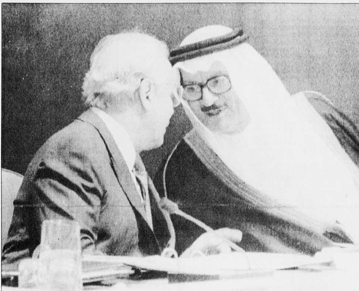
Le nouveau président de l'Assemblée générale des Nations unies, Samir Shihabi (à droite) s'entretient avec le secrétaire Javier Peres de Cuellar après son élection. Le représentant de l'Arabie saoudite a obtenu 83 voix sur 150.

Cette procédure permettra au gouvernement d'établir une liste de bases à fermer mais aussi d'attendre, sans doute après les élections, Voir page A-4: Le Canada