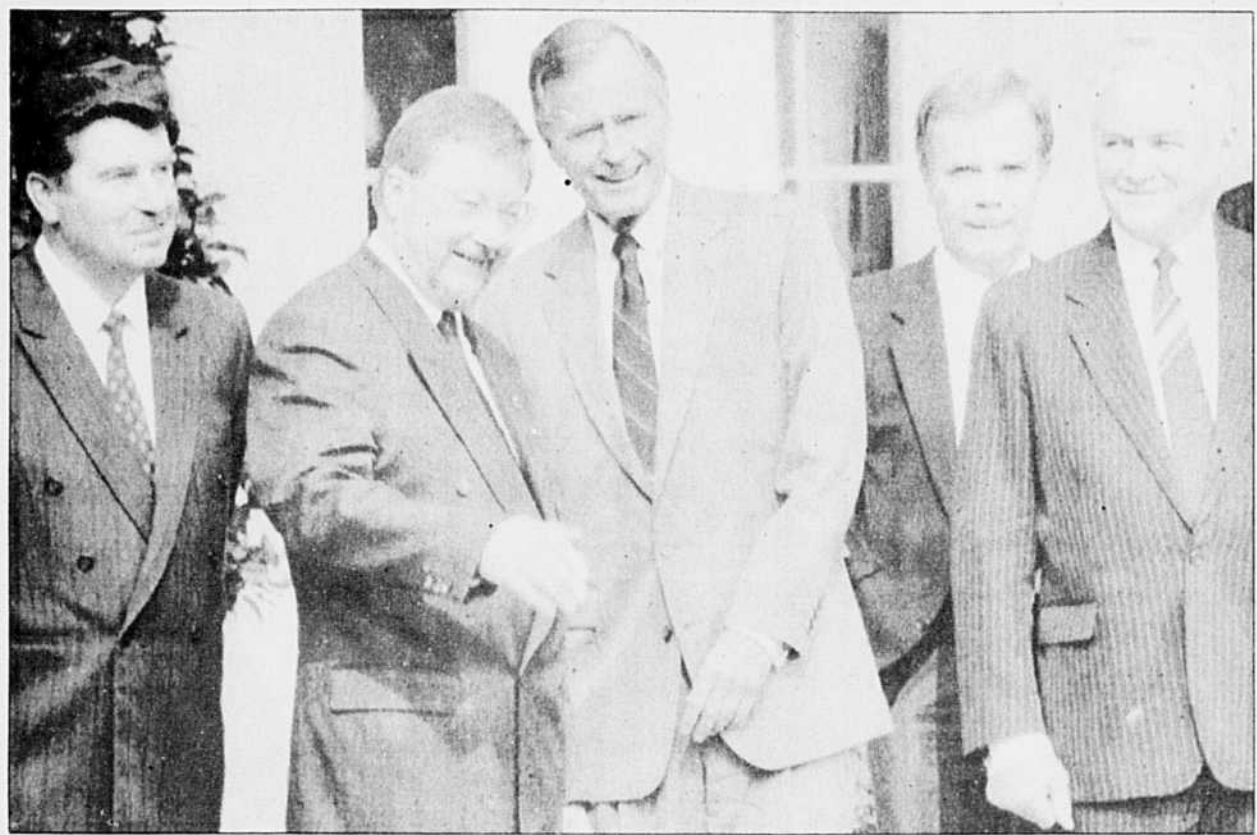
Le président Bush rencontrait hier les présidents des pays baltes. De gauche à droite, Anatoliss Gorbunovs, de Lettonie, Vitautas Landbergis, de Lituanie, et à l'extrême droite, Arnold Fedorovich, d'Estonie.

London estime pour sa part que l'Union de l'Europe occidentale (UEO) devrait envoyer environ 30 000 hommes en Yougoslavie pour avoir une chance d'y faire respecter le cessez-le-feu entre les factions bellicieuses.