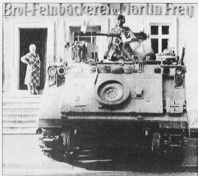
Un char canadien sous l'oeil attentif d'une villageoise lors d'un exercice récent dans la campagne allemande. Une scène qui ne sera bientôt plus qu'un souvenir.

« Parfaitement conscient de votre sentiment d'avoir été trahis après le référendum, dit-il, parfaitement conscient de votre sentiment d'avoir été rejetés après l'échec de l'accord du lac Meech, et parfaitement conscient aussi de l'impression que vous savez que les choses ont assez duré, Voir page A-4: Clark