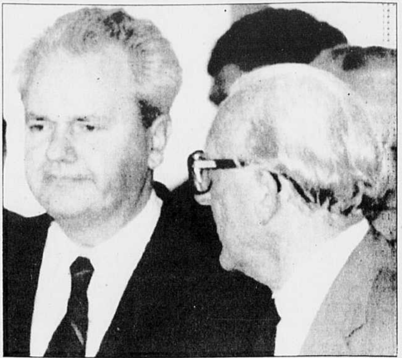
Le président serbe communiste Slobodan Milosevic (à gauche) et l'envoyé spécial de la CEE, lord Carrington.

En revanche, hier, le Portugal s'est dit opposé à l'envoi d'une telle force européenne, ajoutant préférer un déploiement de Casques bleus de