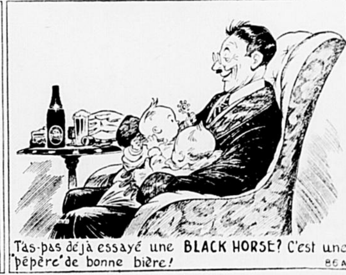
T'as-pas déjà essayé une BLACK HORSE ? C'est une "pépère" de bonne bière!