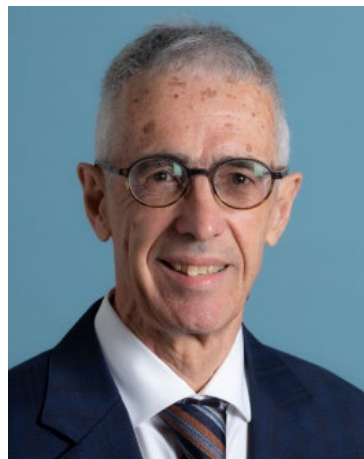
Figure majeure de la dramaturgie québécoise, Michel Marc Bouchard est l'auteur d'une œuvre monumentale s'étendant sur plus de 40 ans de création et de reconnaissance. Ses pièces, qui exposent son attachement à ses racines jeannoises, se déploient dans des thèmes à portée universelle et sont livrées dans une écriture classique aux accents lyriques. À ce jour, elles ont donné lieu à pas moins de 450 productions présentées dans quelque 30 pays.