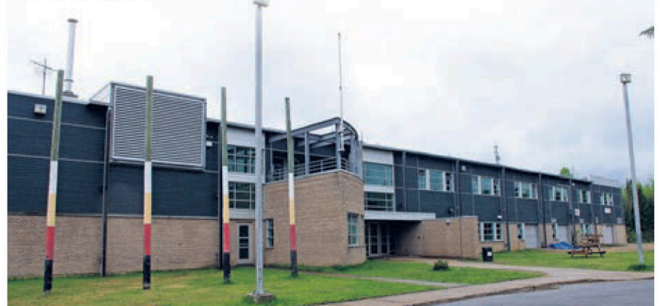
L'école Nikanik à Wemotaci.

SCIENCE. L'organisme du Bassin versant Saint-Maurice (BVSM) se rendra à Wemotaci cet automne afin de réaliser des ateliers scientifiques à l'école secondaire Nikanik.