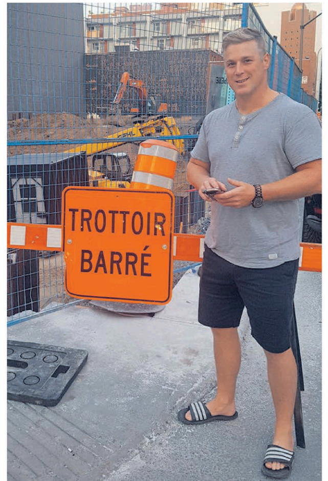
L'entrepreneur du Latuquois de 34 ans est fier du positionnement de son entreprise.

« Mes meilleurs chums sont encore là. Les gars de La Tuque pour moi sont différents, uniques. Je suis très terre à terre et je crois que c'est La Tuque qui m'a donné ça. »