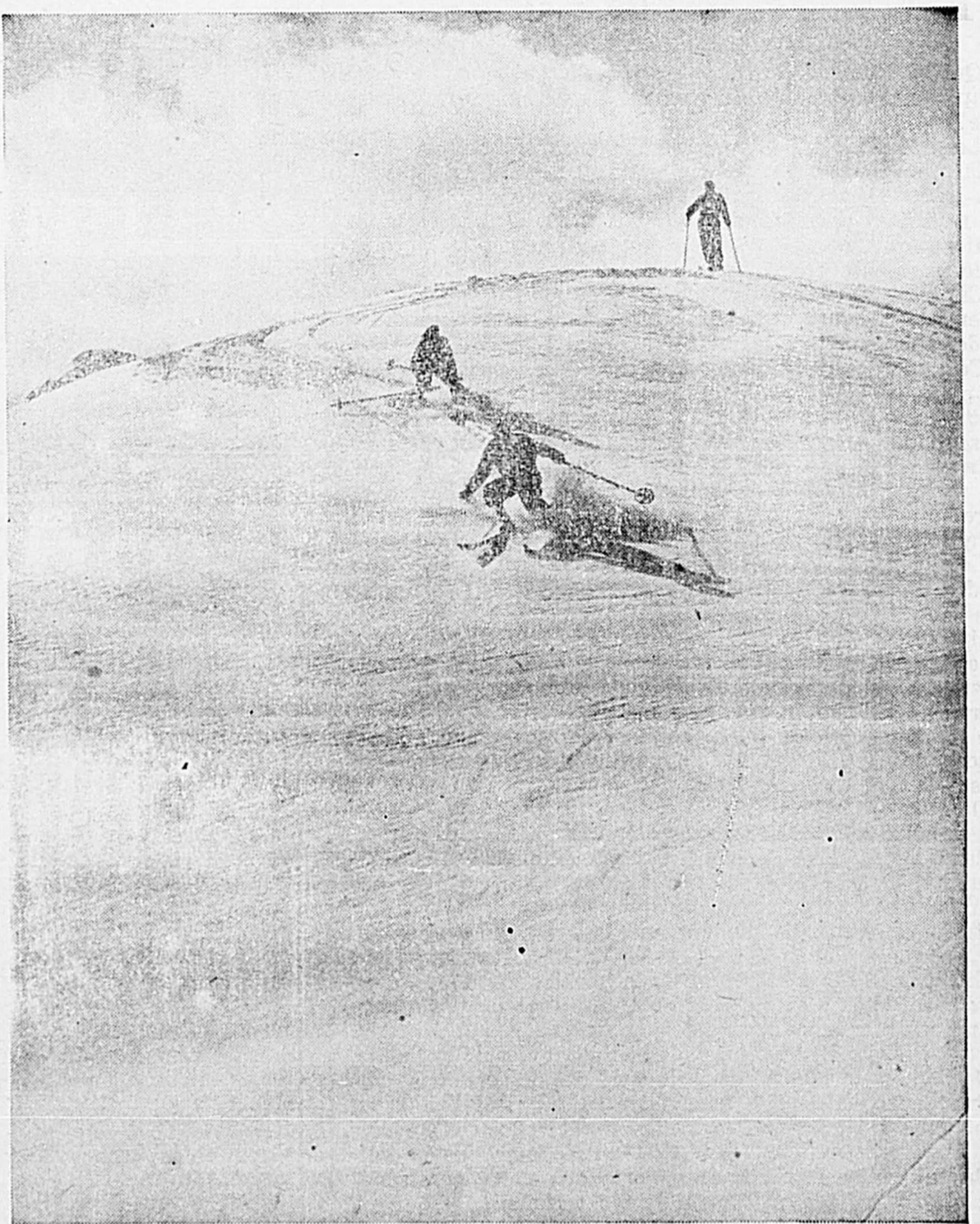
Les Laurentides, terre promise des skieurs!

Les Laurentides, au nord d'Otawa, de Montréal, des Trois-Rivières et de Québec, offrent pour le ski des avantages multiples et exceptionnels. Cette vaste région sportive et touristique offre un effet en ensemble merveilleux de monts et de vallées qui en fait un véritable paradis pour les amateurs de sport d'hiver, surtout du ski, qui prime tous les autres sports de neige. Il n'est donc pas surprenant de constater de quelle vogue grandissante jouissent maintenant les Laurentides auprès des skieurs du Canada et de l'étranger, depuis que le ski a pris l'essor phénoménal auquel nous assistons dans toutes les parties du monde. Un des grands avantages des Laurentides, est leur facilité d'accès par les diverses lignes du Pacifique Canadien qui les desservent et qui permettent aux skieurs d'atteindre en très peu de temps les terrains les plus propices aux belles descentes. C'est aussi là un avantage qui favorise considérablement les excursions de "cross-country", qui deviennent chaque année de plus en plus populaires. La belle photo reproduite ici, que l'on pourrait croire prise en Suisse ou dans les Rocheuses, fait voir une des pentes du mont Loup-Garou, près de Ste-Adèle.