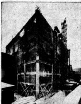
Edifice Railway Exchange Montréal