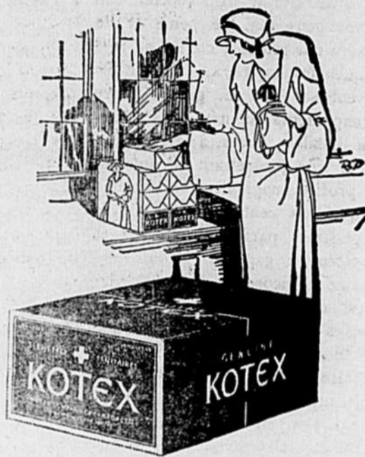
En 2 grandeurs: Kotex Régulier et Kotex-Super; 12 par paquet