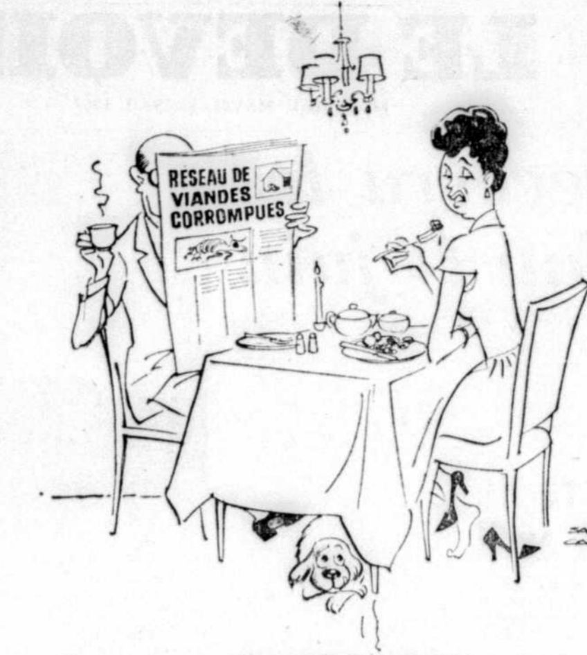
Les grands reportages

"Cette manière rigide de penser... fut, croyons-nous, un trait de notre élite. Elle demeure encore vivace de nos jours en plusieurs milieux". C'est ce qu'on peut vérifier tous les jours, en particulier à l'occasion des problèmes suscités par les réclamations