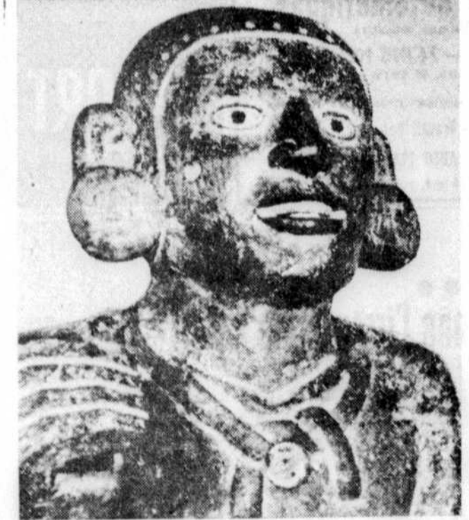
Dieu du Feu civilisation azèque

BRUXELLES. — L'écrivain et dramaturge belge Michel de Ghelderode est décédé avant hier à Bruxelles à l'âge de 64 ans. Considéré généralement comme un des nouveaux du théâtre du 20ème siècle, chrétien très sincère, on l'a souvent qualifié de "Prince du Paradoxe". Michel de Ghelderode qui était né à Ixelles, rue de l'Arbre Bénit, en 1898, a publié ses premiers écrits en 1915. Le théâtre de Michel de Ghelderode a été couronné à plusieurs reprises: Prix Picard (1928), Prix Fondation Rubens (1933), Prix Triennal de la Société nationale des droits d'auteurs (1945). L'écrivain a été également proposé pour le prix Nobel. Sa dernière oeuvre, "Les Entrefiens d'Ostende", a été publiée en 1956. Son dernier article a paru en février dernier dans "Les Cahiers de la Bilique", revue médicale Gantoise. Il était intitulé "Les Erances" et dédié à la ville de Gand. Les oeuvres complètes de Michel de Ghelderode ont été publiées en France en France à différentes reprises.