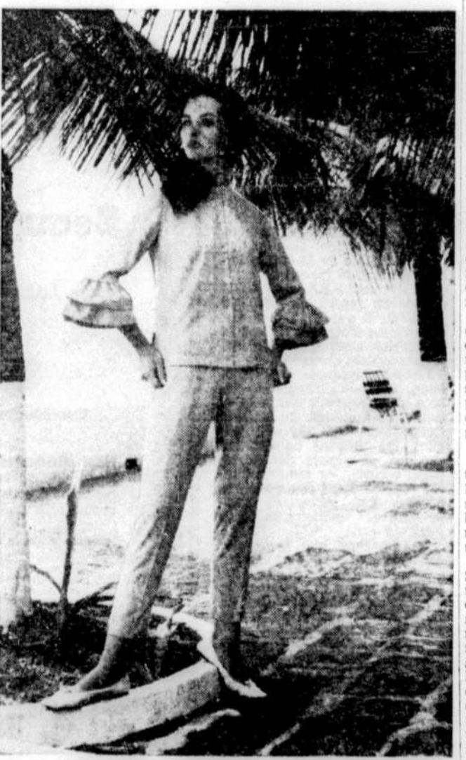
Un modèle canadien d'allure mi-sport est bienvenu dans la garde-robe du voyage. Le pantalon et la chemise à volants sont une création Leberg en pimpante popeline à mélange d'Arnel et avron. Photographié en aquabreu sur le patio de l'hôtel Bonnie Dundee, à la Barbade.