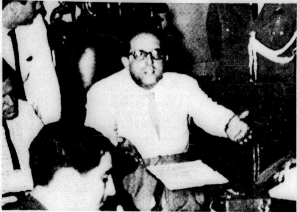
Le gouverneur de la province de Guanabara, Carlos Lacerda, adversaire politique de Goulart, annonce aux journalistes la saisie du système téléphonique de sa région, une industrie de $30 millions à capitaux canadiens.