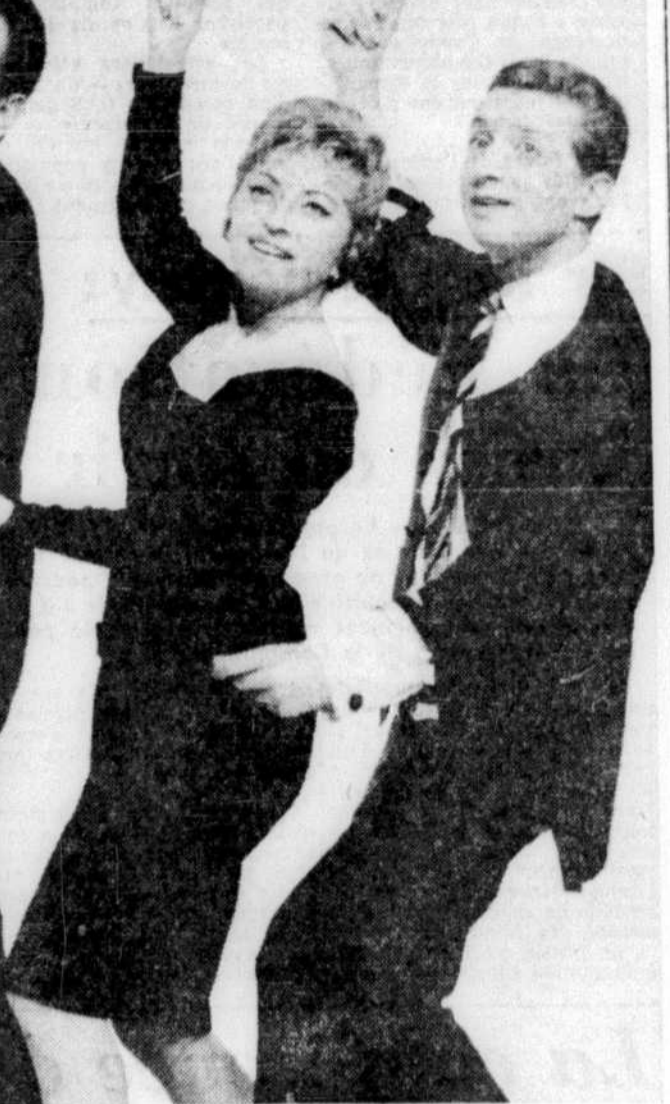
LES TROIS MENESTRELS : Succédant à leur engagement à la Comédie canadienne où leur tour de chant a obtenu un véritable triomphe, les Trio Ménestrels se produisent actuellement à la Tête de l'Art pour une quinzaine de jours.