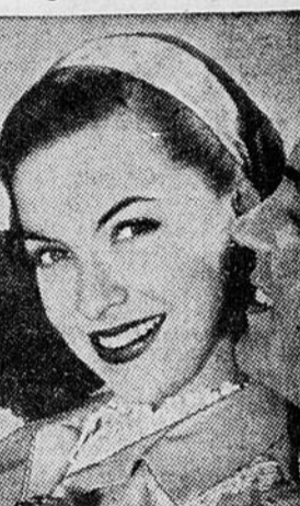
36 Médecins ont éprouvé le traitement Palmolive sur l'épiderme de 1285 femmes.

que 2 femmes sur 3 peuvent avoir un Plus Beau Teint en 14 Jours!