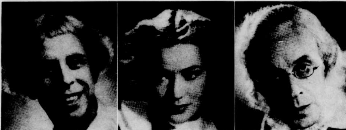
Les trois interprètes principaux de la féerie religieuse Le Chemin du Ciel sont les acteurs suédois (de gauche à droite) : Mats Ersson, Marit Knutsdotter et Var Herre. Ce film de long métrage, doublé en français, passera en exclusivité à CBFT le soir du Vendredi Saint à 9 h. 30.

Sur la fin de sa vie, Mats se remet en route pour son pays natal. La mort le frappe, et Satan vient le réclamer comme sien. Mais le bon Dieu lui tient compte de ses bons sentiments de jadis et lui fait une place au Paradis à côté de la blonde Marie.