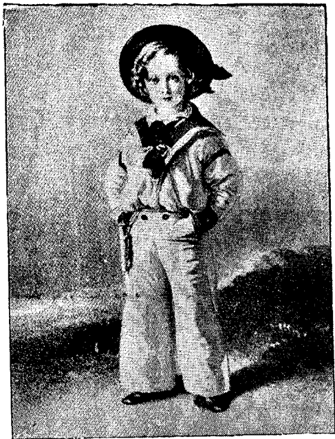
LE PRINCE DE GALLES A L'AGE DE 7 ANS.