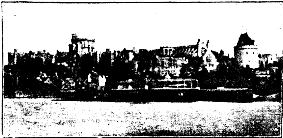
LE BASTION WEST - B