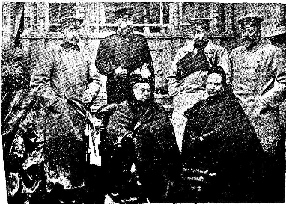
Le Duc de Saxe-Cobourg — Le Duc de Saxe-Cobourg-Gotha — Le Comte d'Albany — Le Prince de Galles Le Duc de Saxe-Cobourg — Le Duc de Saxe-Cobourg-Gotha — Le Comte d'Albany — Le Prince de Galles