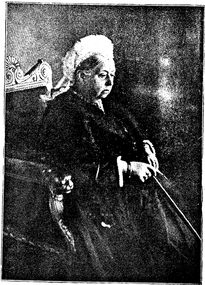
LA REINE VICTORIA EN 1897.