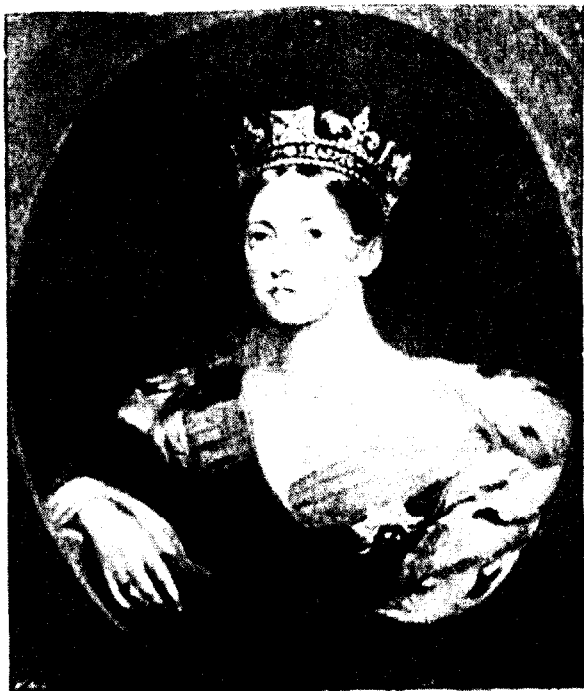
LA REINE VICTORIA EN 1837.