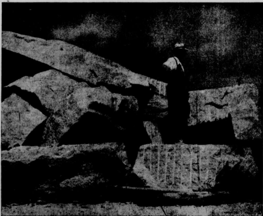
DANS CES ENORMES BLOCS DE PIERRE ON TAILLE LA PIERRE DE CONSTRUCTION POUR EGLISES ET AUTRES EDIFICES PUBLICS.