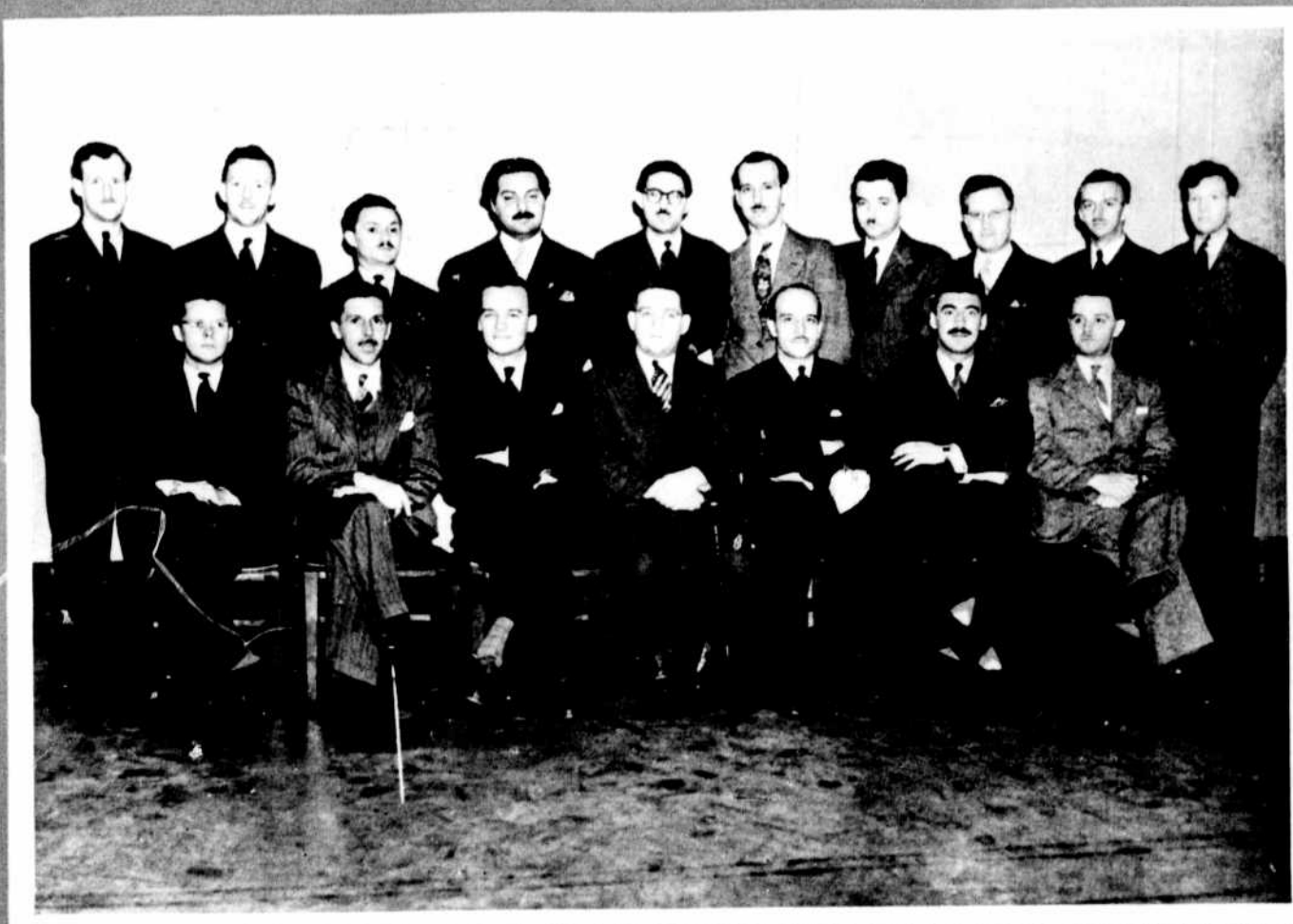
Le conseil de la Chambre des jeunes pour l'exercice 1942 - 1943

DE LA CHAMBRE DE COMMERCE DU DISTRICT DE MONTRÉAL ET DE LA CHAMBRE DES JEUNES