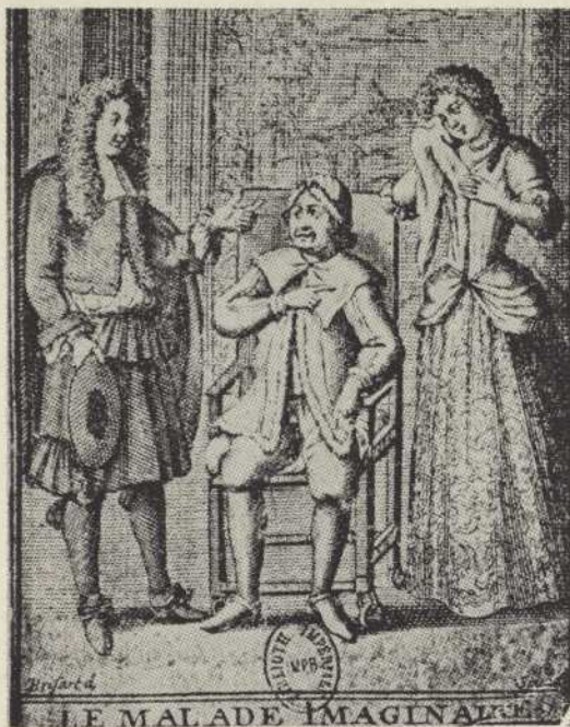
Frontispice de Brisart pour l'édition du Malade imaginaire de 1682.

pour délasser le Roi de ses nobles travaux. Pourtant la pièce avance et aucune commande n'est passée à Molière.