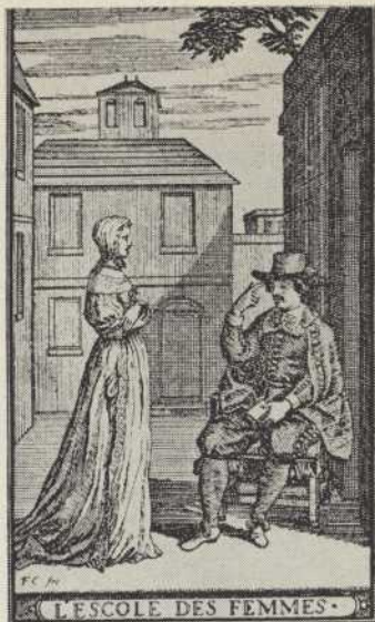
Armande et Molière dans L'École des Femmes ; frontispice gravé par Chauveau (1663)

La première a lieu, sur la scène du Palais-Royal, le 10 février 1673. La recette est forte et le public nombreux rit abondamment. Les représentations subséquentes confirment le succès. Mais le vendredi suivant, 17 février, peu avant le lever du rideau, qui a lieu à quatre heures de l'après-midi, Molière se sent particulièrement mal. Si mal qu'on veut le dissuader de jouer. "Comment voulez-vous que je fasse? répond-il. Il y a cinquante pauvres ouvriers qui n'ont que