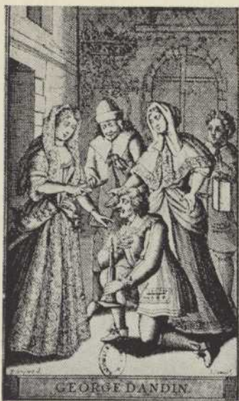
Frontispice de Brisart pour l'édition de Georges Dandin de 1682

leur journée pour vivre; que feront-ils si l'on ne joue pas? Je me reprocherais d'avoir négligé de leur donner du pain un seul jour, le pouvant faire absolument." La représentation a donc lieu et elle se passe tant bien que mal jusqu'au dernier intermède. Durant la cérémonie qui l'élève à la dignité de médecin, en prononçant le premier "juro", Molière est pris d'une quinte de toux, qu'il essaie de dissimuler sous une grimace, et il parvient à terminer la pièce. On le transporte aussitôt à son logis, tout près, en chaise à porteurs. Aucun médecin ne vient le visiter — en a-t-on même demandé un? — Mais ce qui est plus grave, on a toute les peines du monde à avoir un prêtre: celui qui viendra arrivera trop tard. Et Molière n'est réconforté que par la présence de deux petites sœurs quêteuses, à qui il donne l'hospitalité dans sa maison. Il est réconforté aussi par Armande qui, malgré toutes ses cruautés passées, doit lui être très chère à ce moment, et par Baron, dont il a fait son fils spirituel. Jusqu'à la dernière minute, il garde sa lucidité. Vers dix heures, il est secoué d'une nouvelle quinte de toux qui provoque une hémorragie abondante. Il retombe, inanimé... Molière vient de mourir.