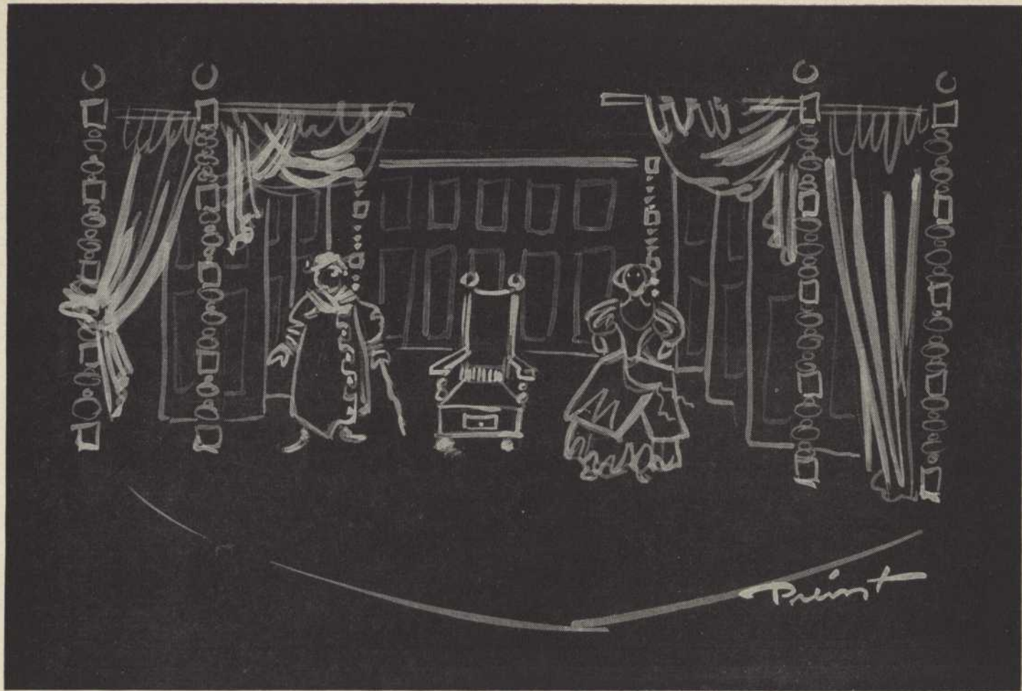
Dessin de Robert Prévost pour Le Malade imaginaire