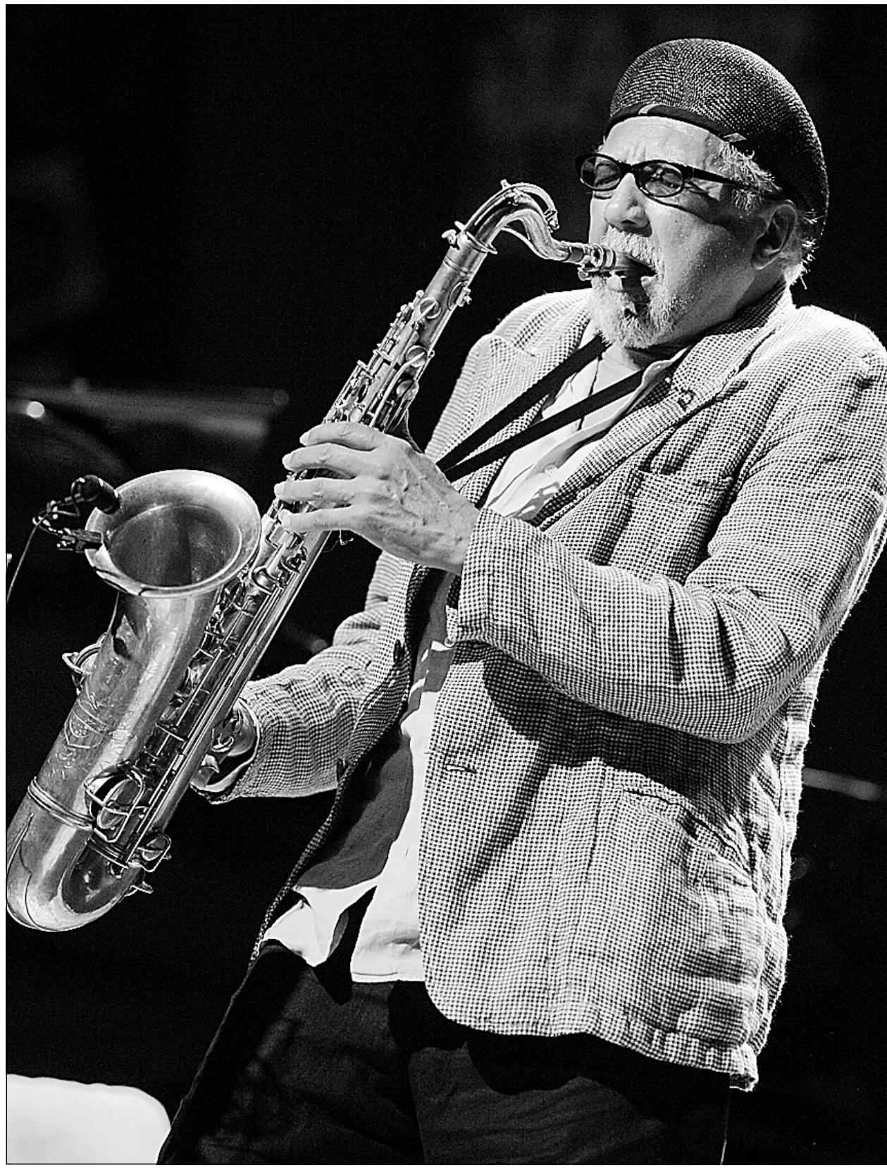
Le saxophoniste ténor et flutiste Charles Lloyd a donné vendredi un très grand concert de jazz au Spectrum, sans doute un des plus mémorables livrés à Montréal au cours des 26 festivals.