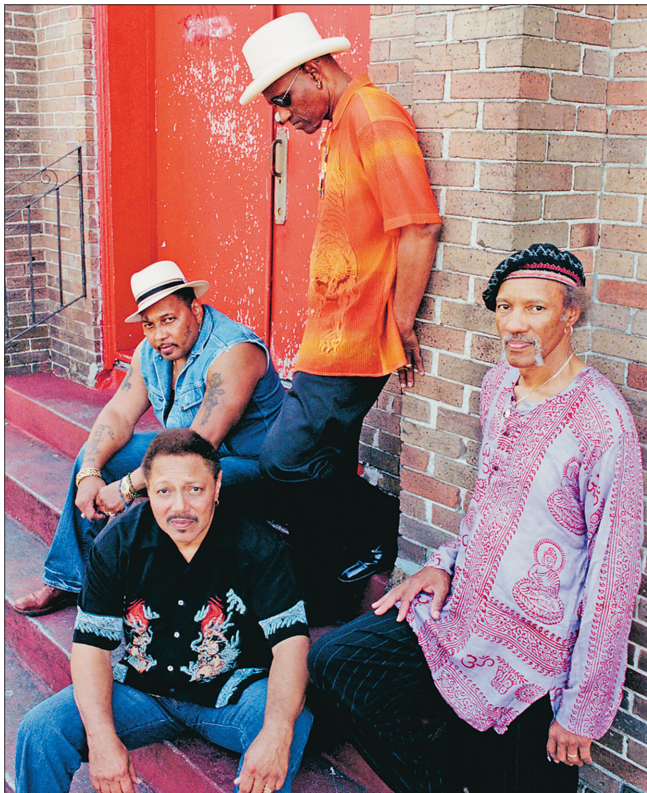
Les Neville Brothers sont au nombre des artistes qui rendront hommage aux grands du soul, ce soir, à la salle Wilfrid-Pelletier de la Place des Arts.