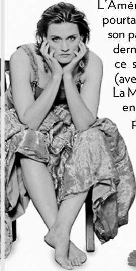
Madeleine Peyroux