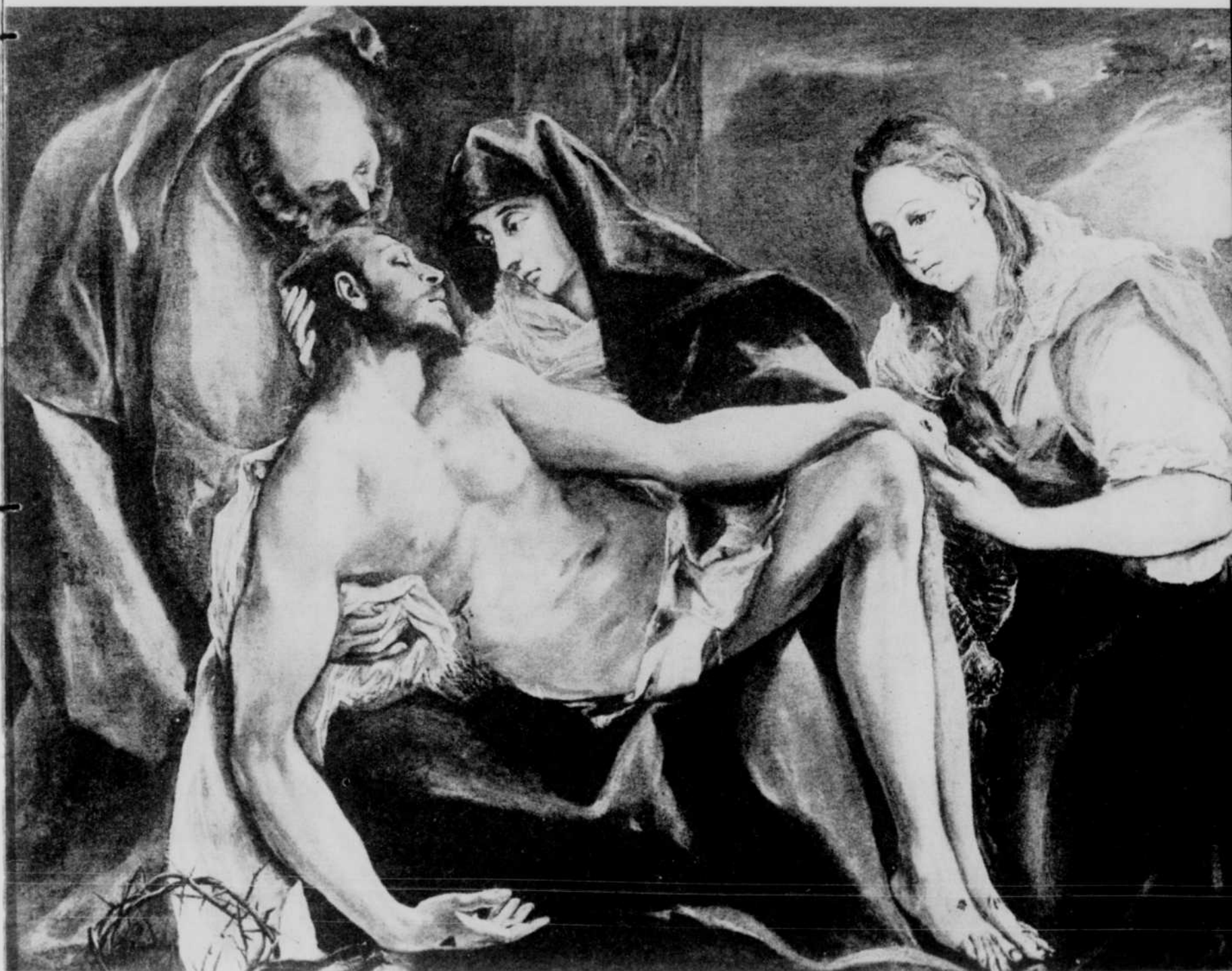
("PIETA" d'El Greco)