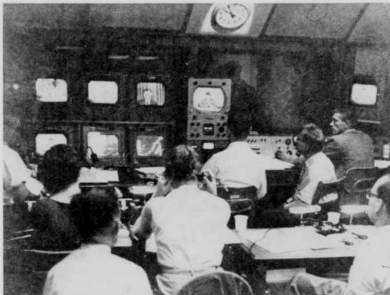
Cette photo a été prise le 10 juin 1957, alors que toutes les facilités techniques des réseaux de télévision de Radio-Canada étaient mobilisées pour donner une image aussi complète que possible du dépouillement du scrutin dans le pays. L'expérience acquise à cette occasion sera d'un précieux apport le soir du 31 mars.