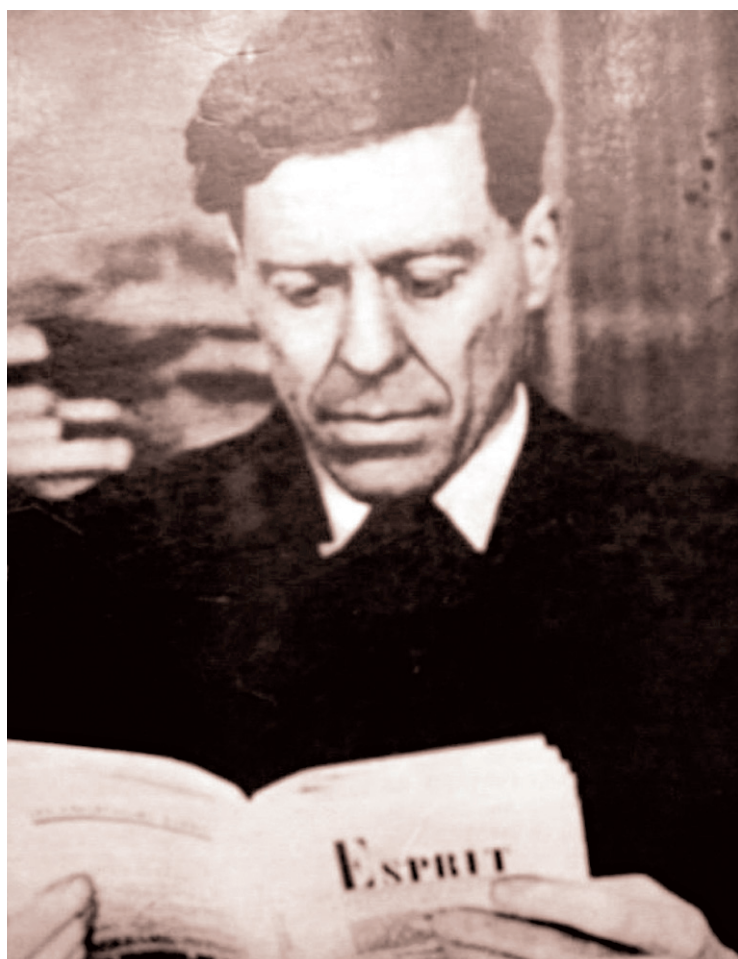
Fondateur de la célèbre revue Esprit , Emmanuel Mounier élabore dans les années 1930 une pensée destinée à protéger la personne face à la montée des totalitarismes en Europe.

Selon Mounier, le fédéralisme semblait être la forme d'organisation politique la plus propice à l'émergence d'une communauté réelle, surtout pour les grands ensembles démographiques. Une autorité politique centrale lui apparaissait nécessaire pour gérer des problèmes de plus en plus complexes et transnationaux, mais les autorités locales étaient