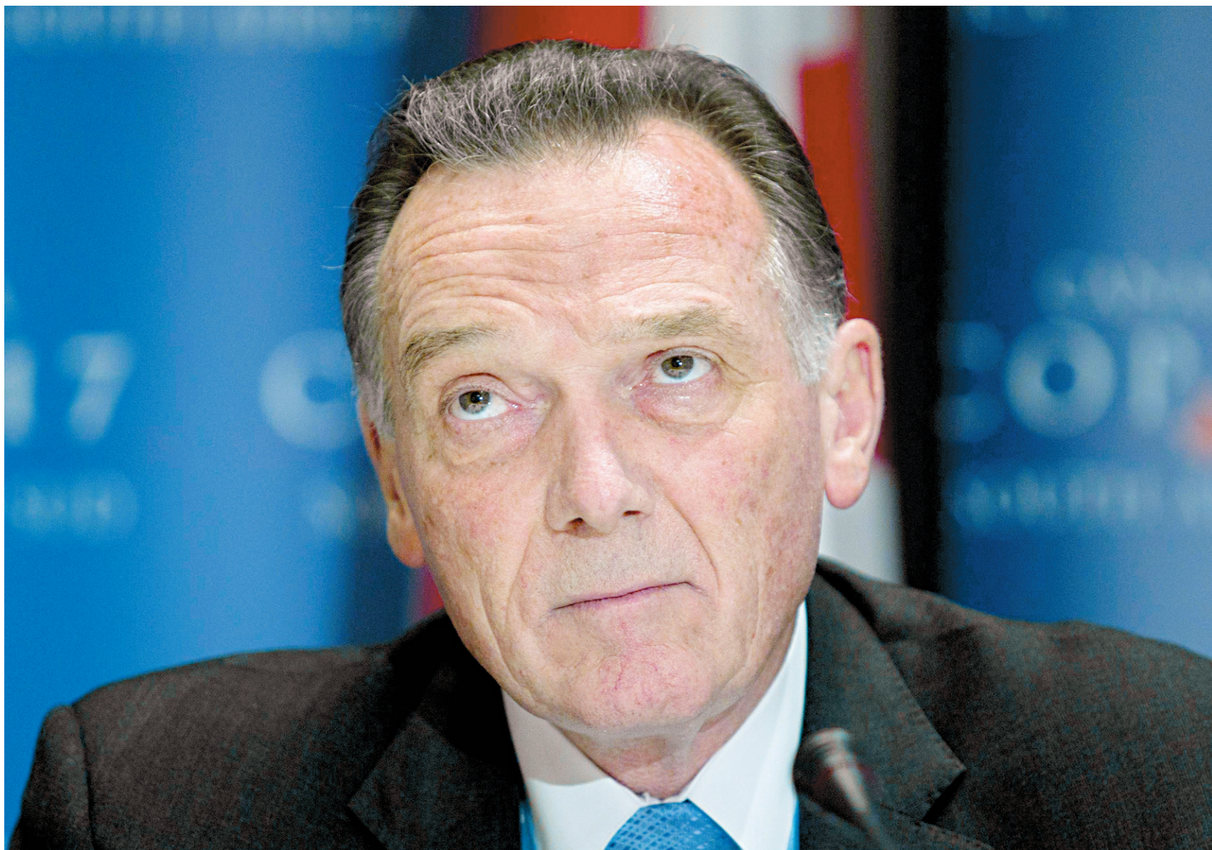
Peter Kent, ministre fédéral de l'Environnement, lors de la conférence internationale de Durban.