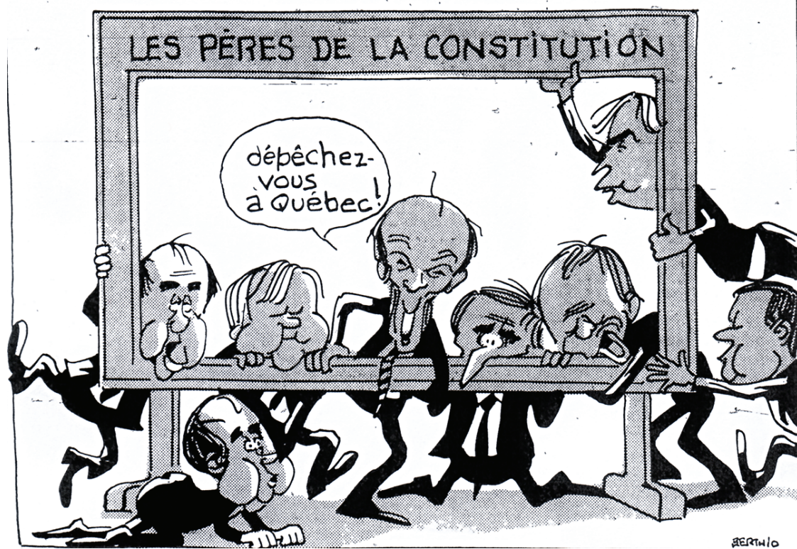
La caricature de Berthio publiée dans Le Devoir du 24 novembre 1981.

tout aussi indispensables pour véritablement permettre l'enracinement des personnes dans une communauté où l'amour, l'amitié et la fidélité deviendraient des valeurs centrales.