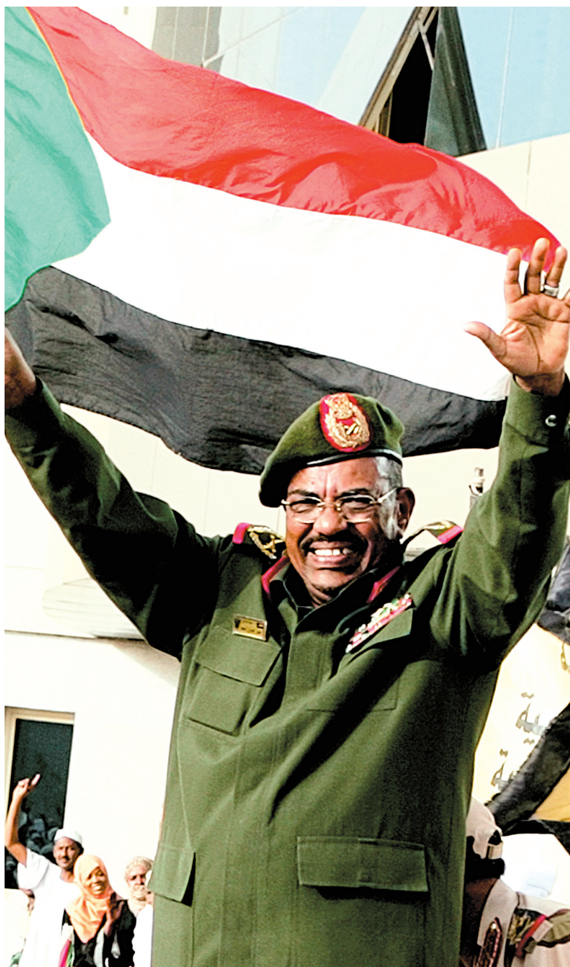
Omar el-Béchir, président du Soudan depuis 1993.

Soixante-dix-neuf soldats soudanais auraient été tués mardi et mercredi au Nil bleu, selon un porte-parole du mouvement rebelle SPLM-N (branche Nord du Mouvement populaire de libération du Soudan). Ces combats ont accéléré les mouvements de population: le camp de réfugiés de Yida accueille désormais jusqu'à 400 nouvelles personnes chaque jour, contre 50 la semaine