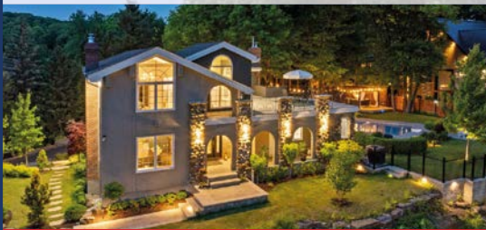
900, CHEMIN DES HIRONDELLES SAINT-BRUNO-DE-MONTARVILLE