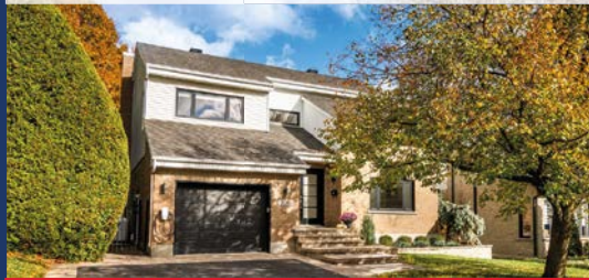
2086, DES ORMES SAINT-BRUNO-DE-MONTARVILLE