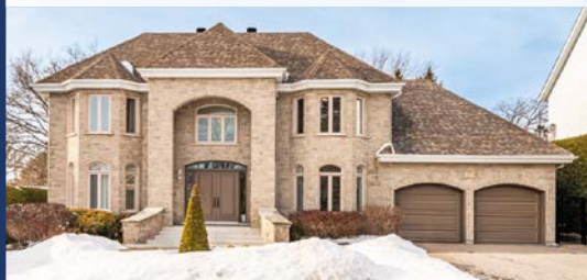
1970, MCINTOSH SAINT-BRUNO-DE-MONTARVILLE