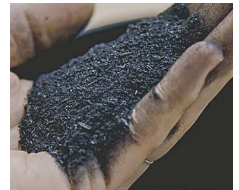
Biochar de ligneux.