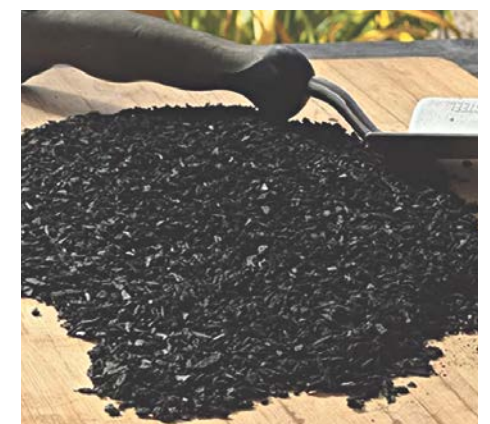
Biochar Québec commercial.