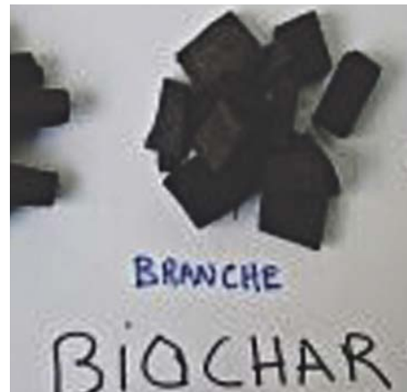
Biochar varié.

Ajoutez du biochar au sol, un peu à la fois, et observez la magie opérer. En intégrant le biochar aux pratiques de jardinage, vous