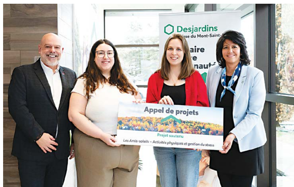
Les représentants de l'organisme Les Amis-Soleils étaient sur place lors de ce dévoilement.