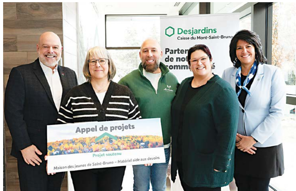
Le projet d'aide aux devoirs de la MDJ de Saint-Bruno a été choisi.