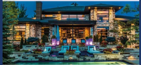
1306, DU BOISÉ BOUCHERVILLE