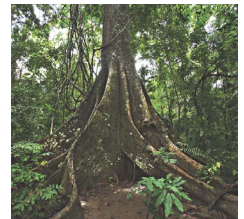
Terra preta Amaz.

améliorez non seulement la productivité du sol, vous réduisez l'empreinte carbone. En tant que microhabitat, il devient une réserve de nutriments pour les plantes et agit comme une éponge pour l'eau, l'azote et de nombreux oligoéléments. Le biochar aide à protéger contre la sécheresse et les inondations. Il élimine des résidus chimiques et les entraîne sous des formes insolubles.