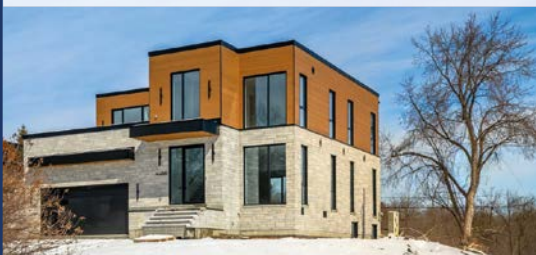
2040, DU SOMMET-TRINITÉ SAINT-BRUNO-DE-MONTARVILLE