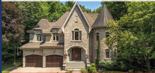
1432, FRANÇOIS-P.-BRUNEAU SAINT-BRUNO-DE-MONTARVILLE