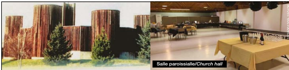
Salle paroissiale/Church hall

Église catholique St. AUGUSTINE of CANTERBURY à Saint-Bruno Unité pastorale anglophone de Saint Jean Paul II