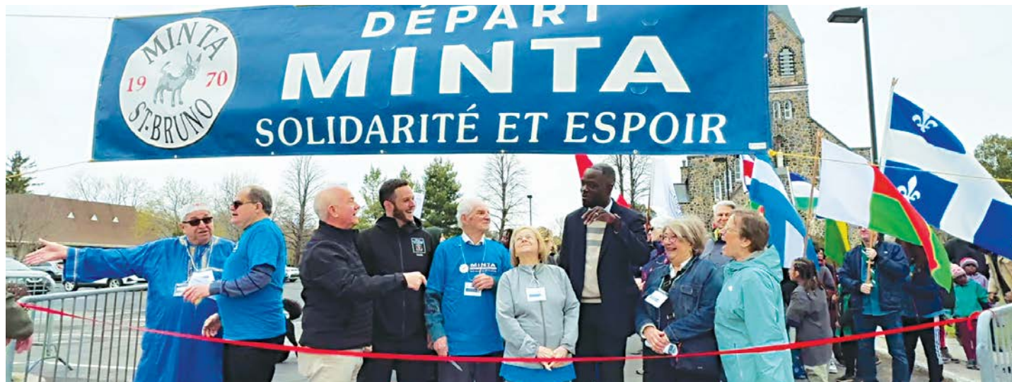
La prochaine Marche MINTA aura lieu le 2 mai.

Cette activité, ouverte à tous, offre ainsi une occasion idéale pour les familles et les citoyens de Saint-Bruno et de Saint-Basile-le-Grand de se rassembler en guise de solidarité auprès des communautés épaulées par MINTA. La participation est gratuite et l'événement se conclut par un pique-nique convivial où les hot-dogs sont offerts aux marcheurs.