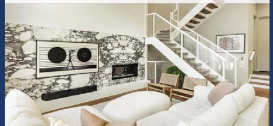
12-302, RANG DES VINGT SAINT-BASILE-LE-GRAND