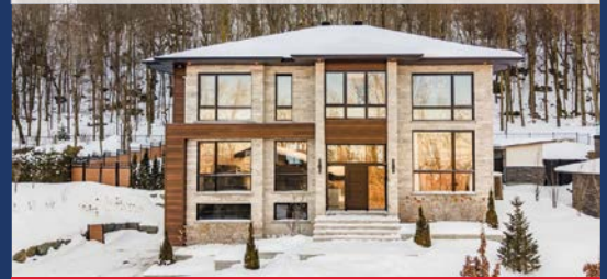
760, DES CHARDONNERETS MONT-SAINT-HILAIRE