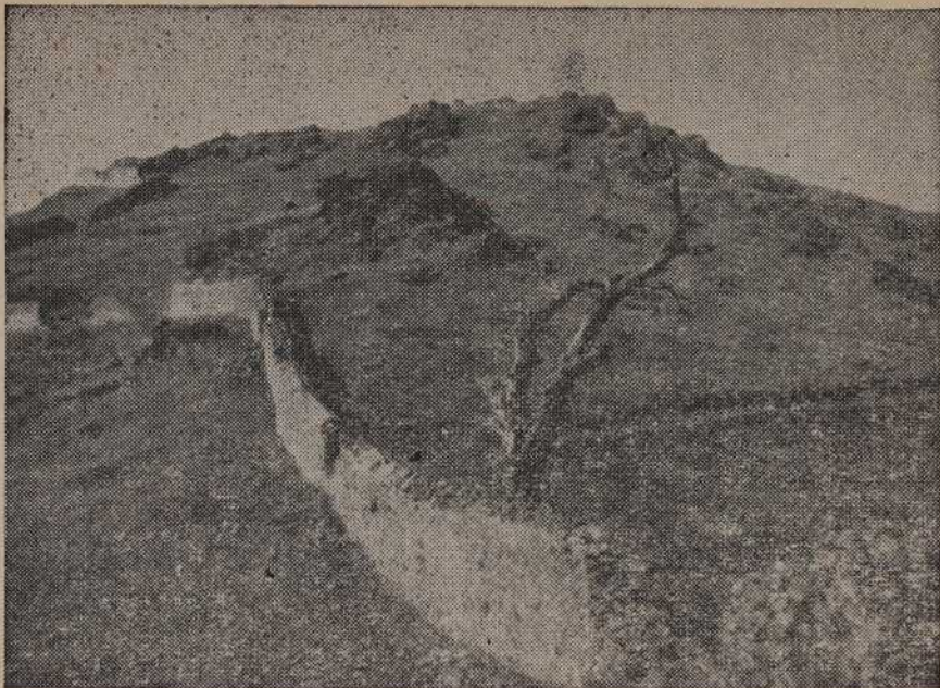
L'Arbre Sec à Carnolet.