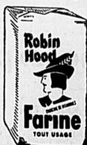
FARINE Tout usage